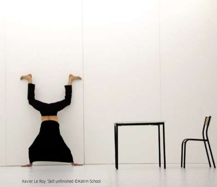
Xavier Le Roy "Self unfinished"