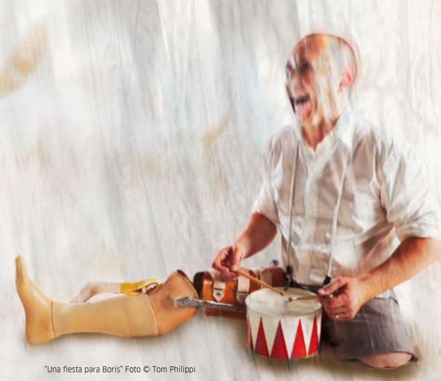
“Una fiesta para Boris”