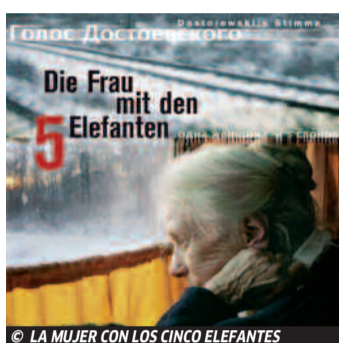
© LA MUJER CON LOS CINCO ELEFANTES

>> Goethe-Institut - Oficina de cursos L-V: 10-13 / 17-18 h [Zurbarán, 21]