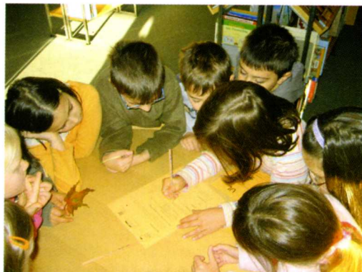
„Rajd” po Bibliotece Miejskiej w Schwäbisch Gmünd

Następnie dzieci same zostają wysłane w podróż: mają do dyspozycji skopiowane egzemplarze wszystkich listów wysłanych z różnych działów (książki ilustrowane, pierwsze lektury, literatura faktu...) – rozróżnione kolorystycznie – które należy uzupełnić w odpowiednim miejscu. Najprostsza forma polega na tym, by w wolnym miejscu w liście wpisać odpowiedni tytuł samodzielnie wybranej książki. W tym celu dzieci muszą odnaleźć właściwe miejsce i obejrzeć stojące tam pozycje. (Listy dla starszych dzieci można sformułować tak, by należało rozwiązać trudniejsze zadania tekstowe.) Każdy gotowy list trafia do koperty i znika w skrzynce z tektury. Gdy wszystkie dzieci „wysłały” już swoje listy, wyjmujemy je ze skrzynki i sortujemy według kolorów (widocznych przez okienko w kopercie).