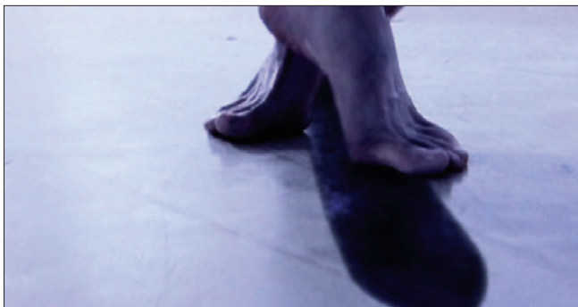
© Aleksander Bach / Bodo Eckert

Ich habe viele Chancen versäumt, in meinem Leben viel zu sehr geträumt. Diese Erkenntnis trifft mich wie ein Schlag. Ich mache die Augen auf. Der fade Geschmack von Wirklichkeit liegt bitter in meinem Mund. Was kann ich tun, was muss sich ändern? Warum ist es bloß so schwer, nicht den Halt zu verlieren. Jetzt muss es einfach