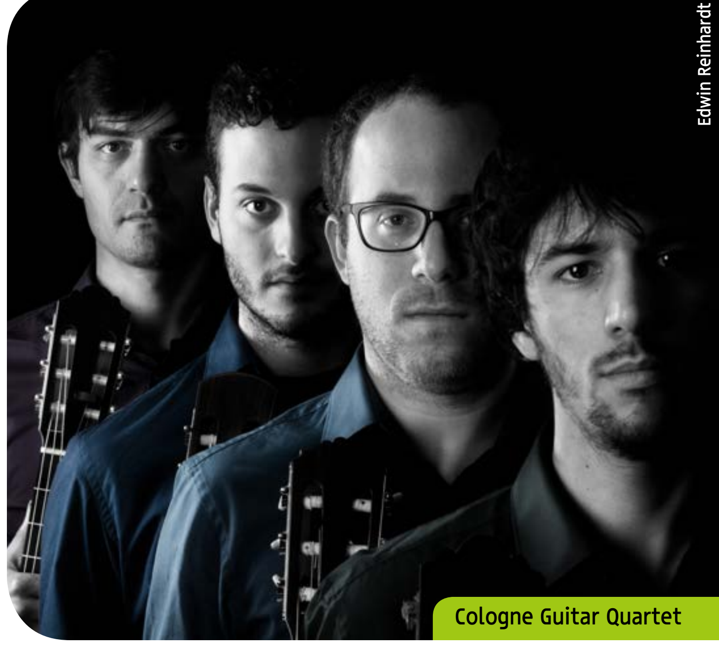
Cologne Guitar Quartet