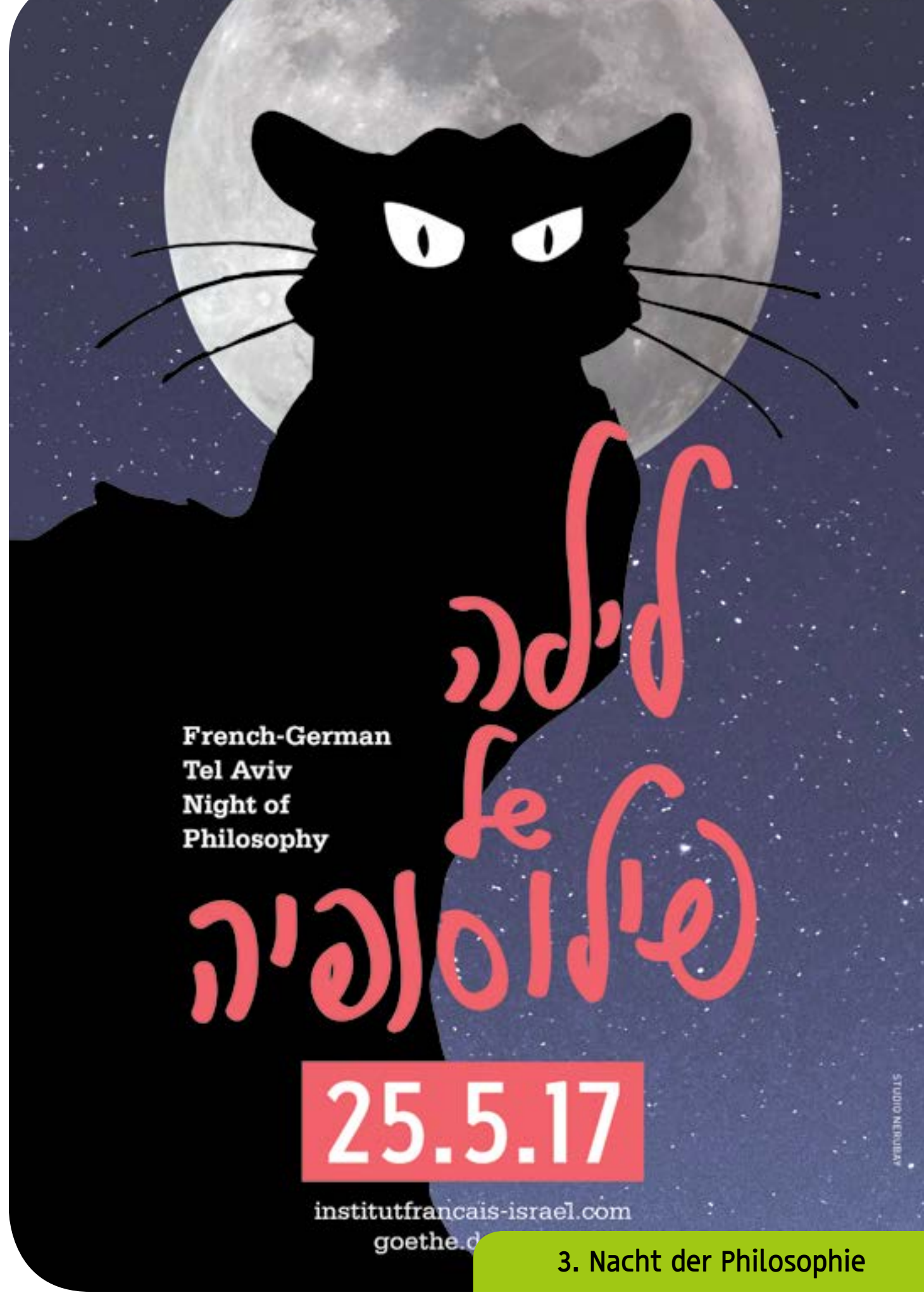
3. Nacht der Philosophie