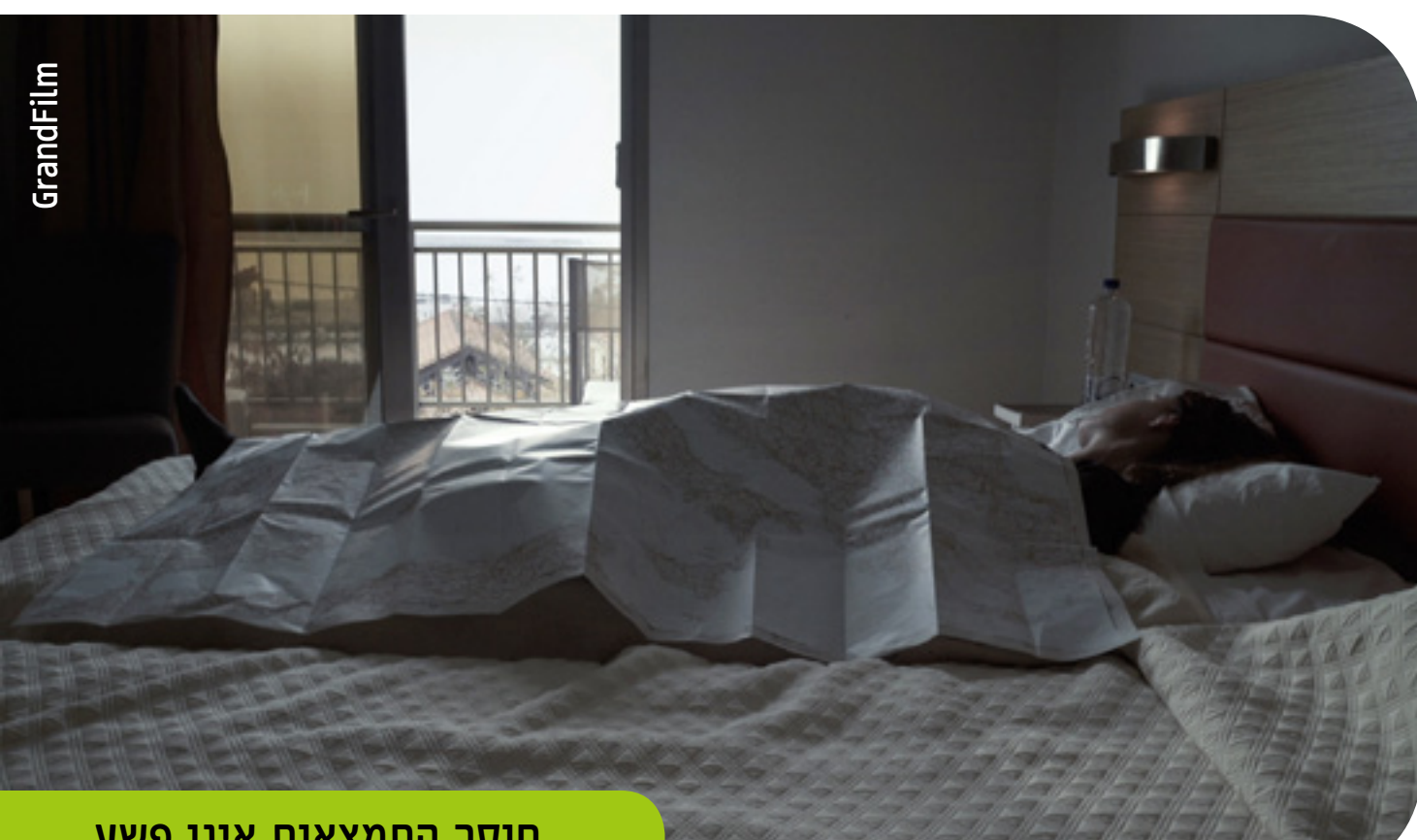
חוסר התמצאות אינו פשע