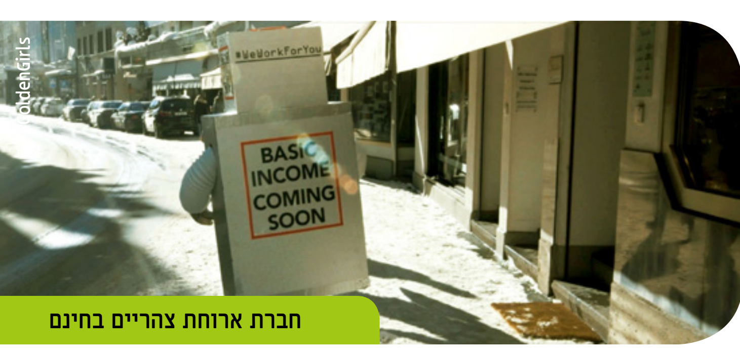
חברת ארוחת צהריים בחינם