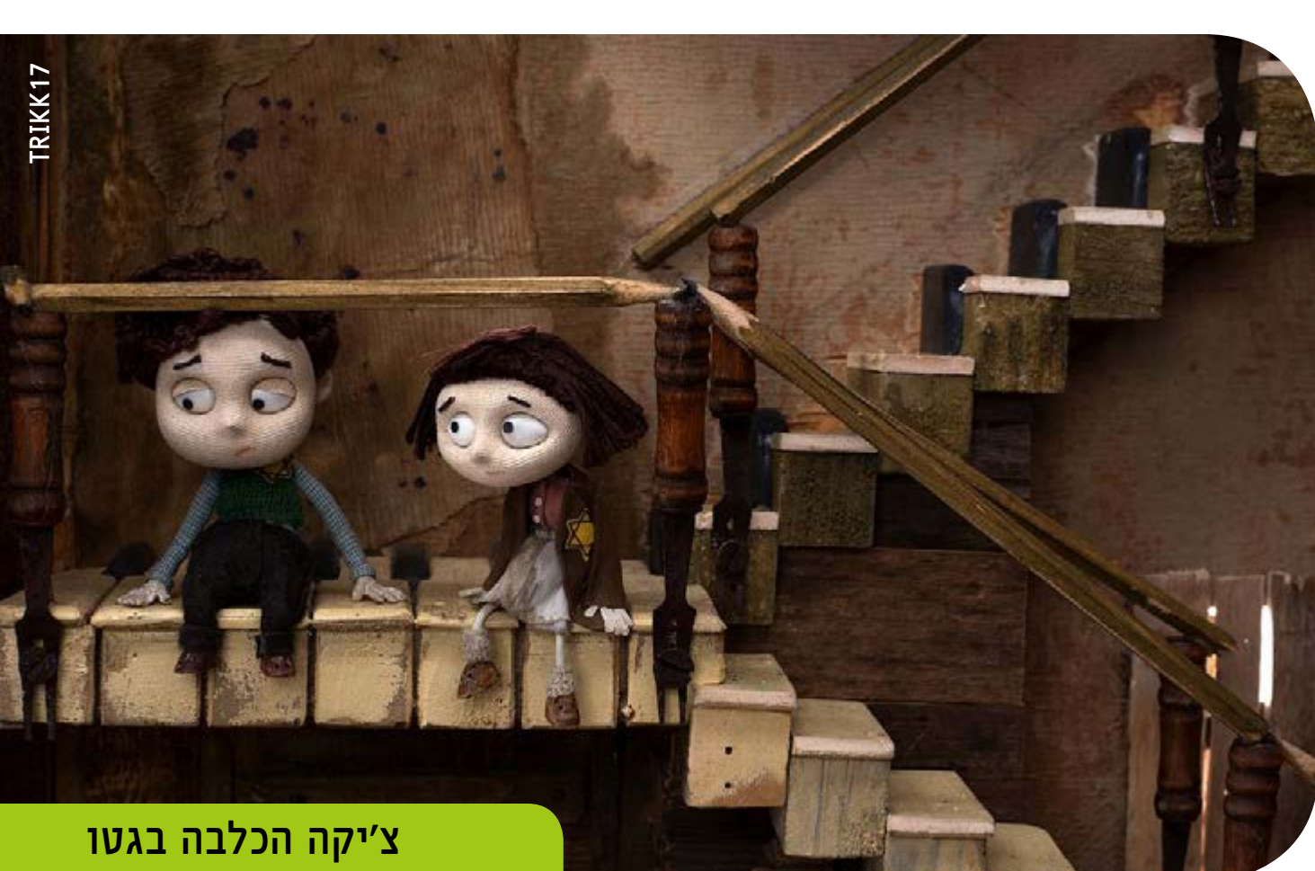
צ'יקה הכלבה בגטו