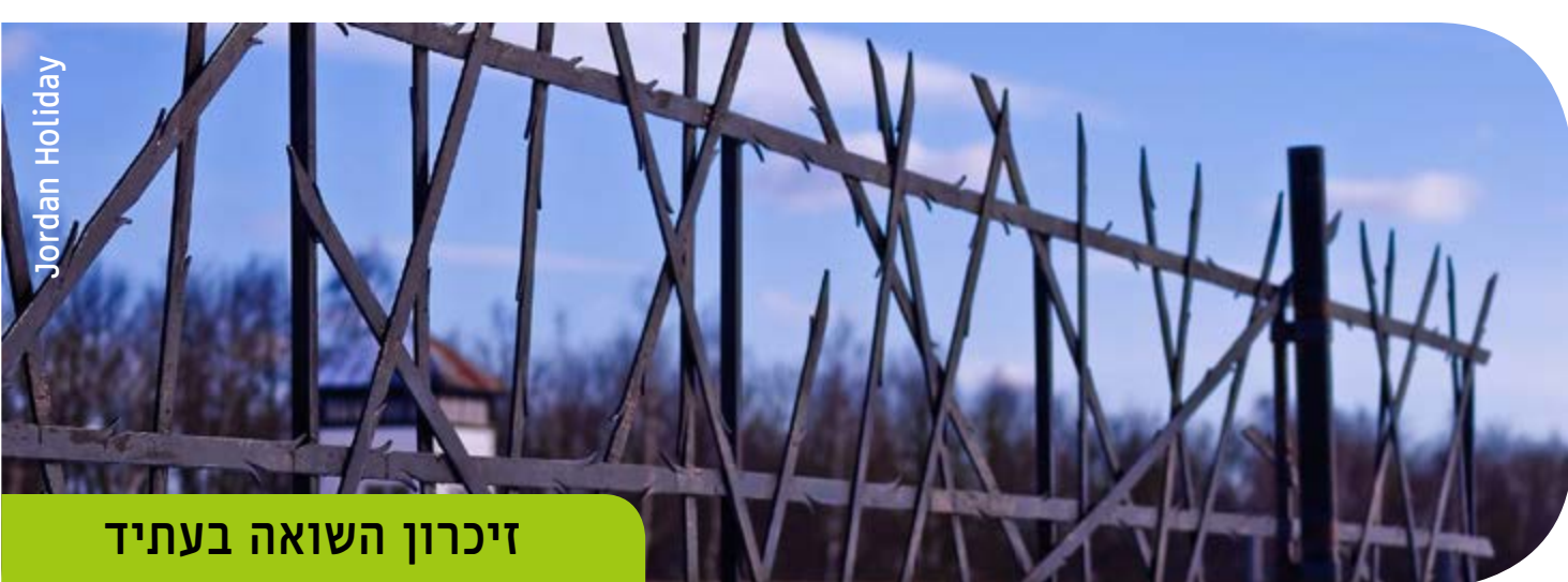
זיכרון השואה בעתיד