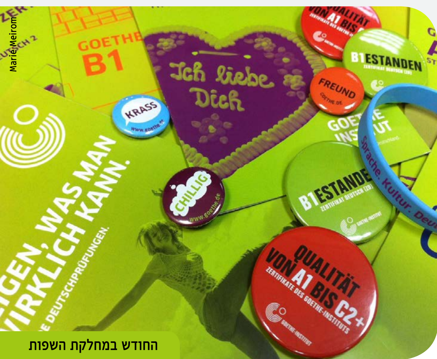
החודש במחלקת השפות

קורסים חדשים למתחילים ולמתקדמים נפתחים בתל אביב בסוף חודש אפריל ובירושלים בתחילת חודש מאי. למידע והרשמה: תל אביב 03-6060503 ירושלים 02-6508500