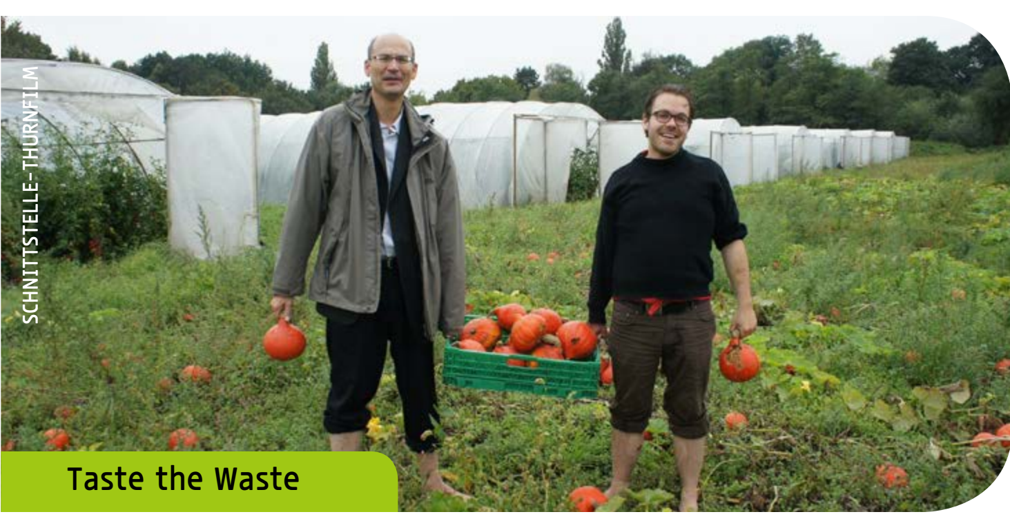
Taste the Waste