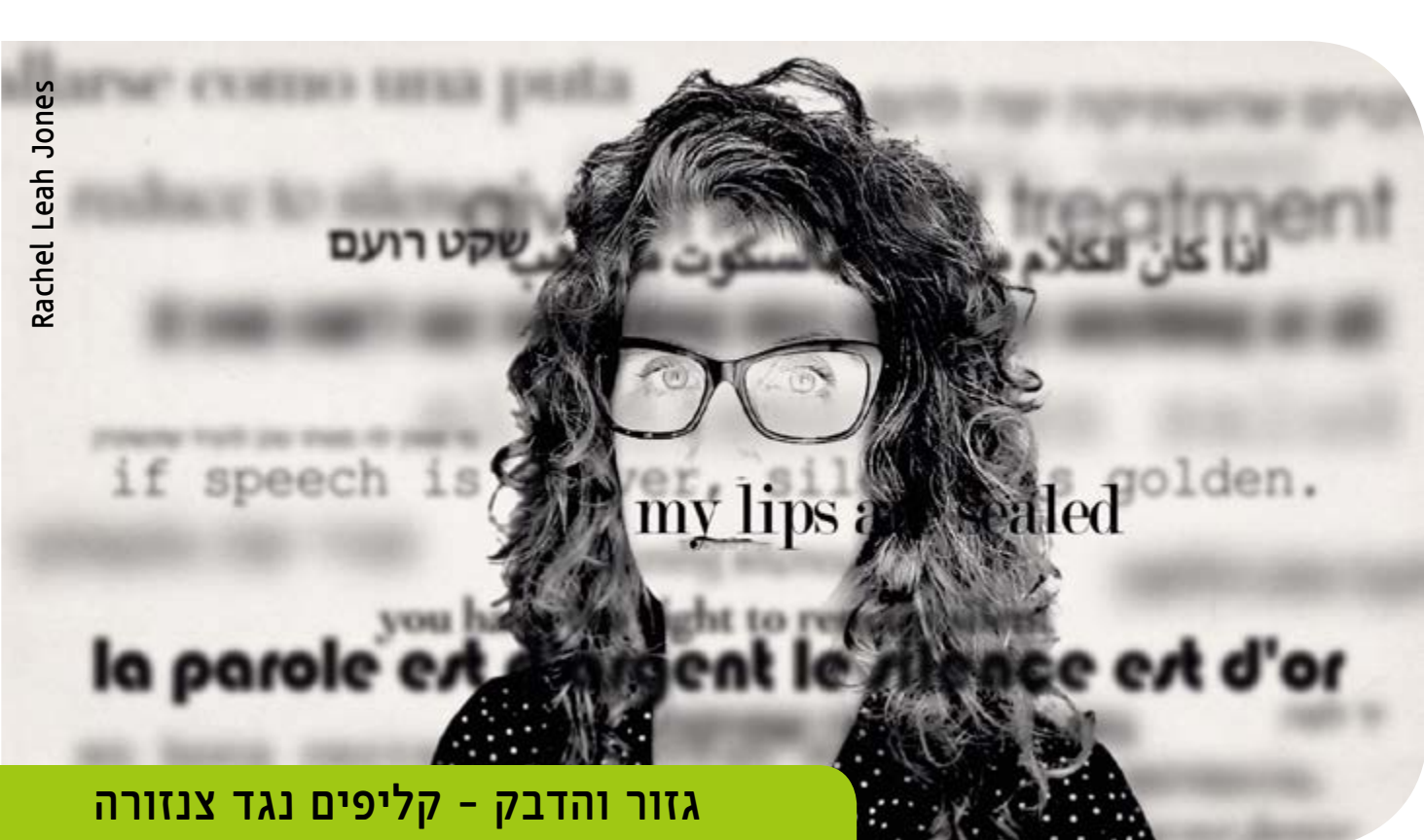
גזור והדבק - קליפים נגד צנזורה