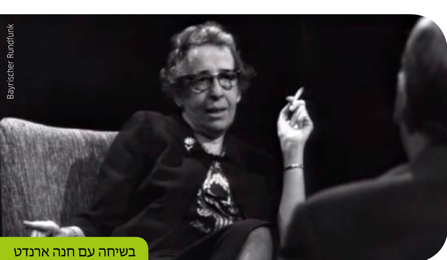
בשיחה עם חנה ארנדט