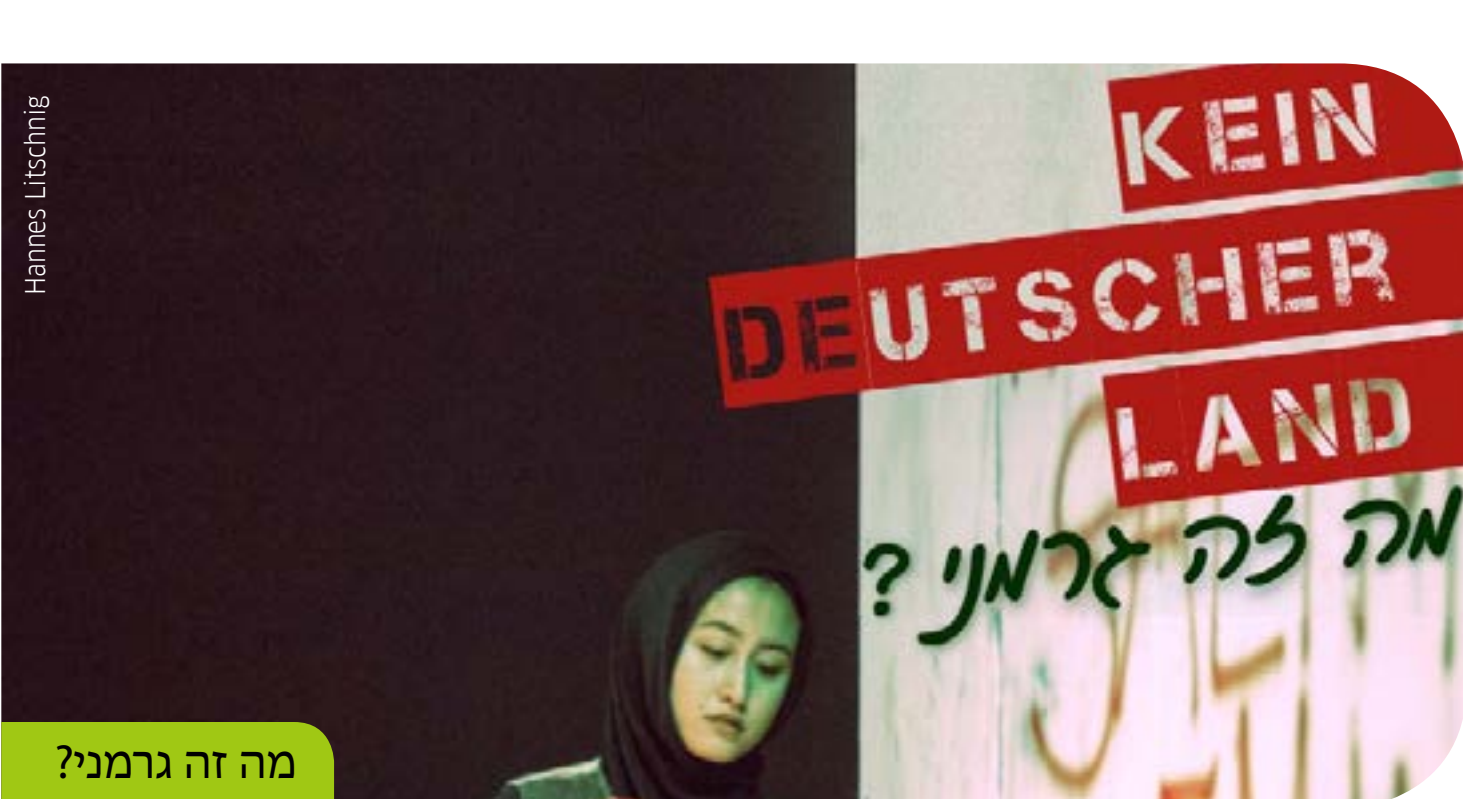
מה זה גרמני?