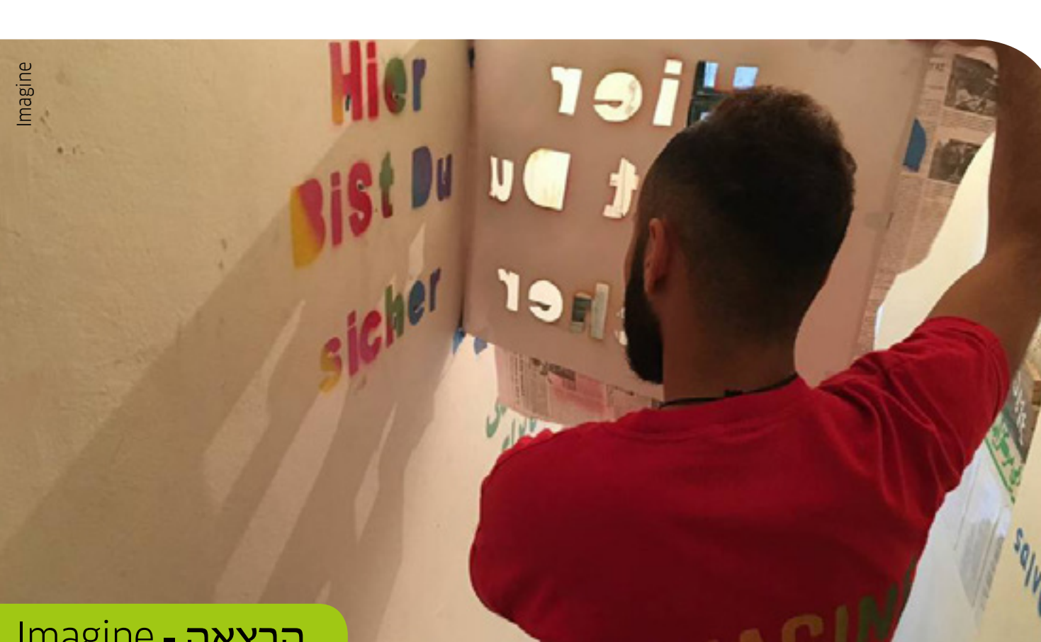
הרצאה - Imagine