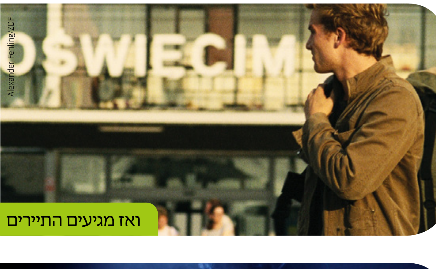
ואז מגיעים התיירים