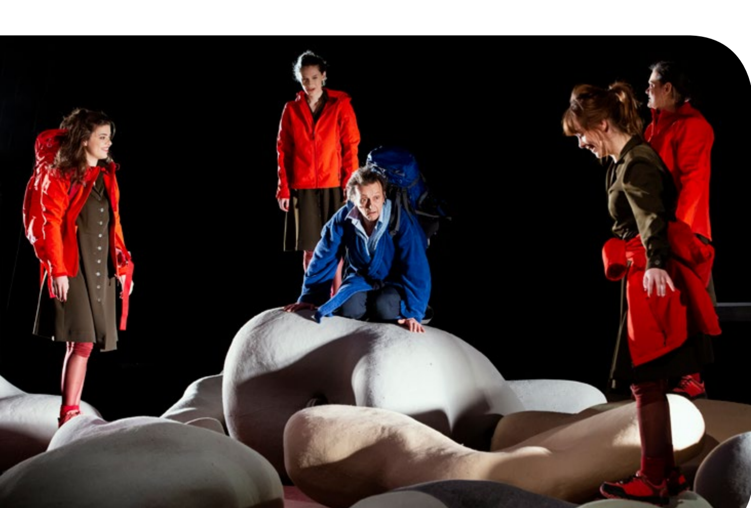
אישה בורחת מבשורה