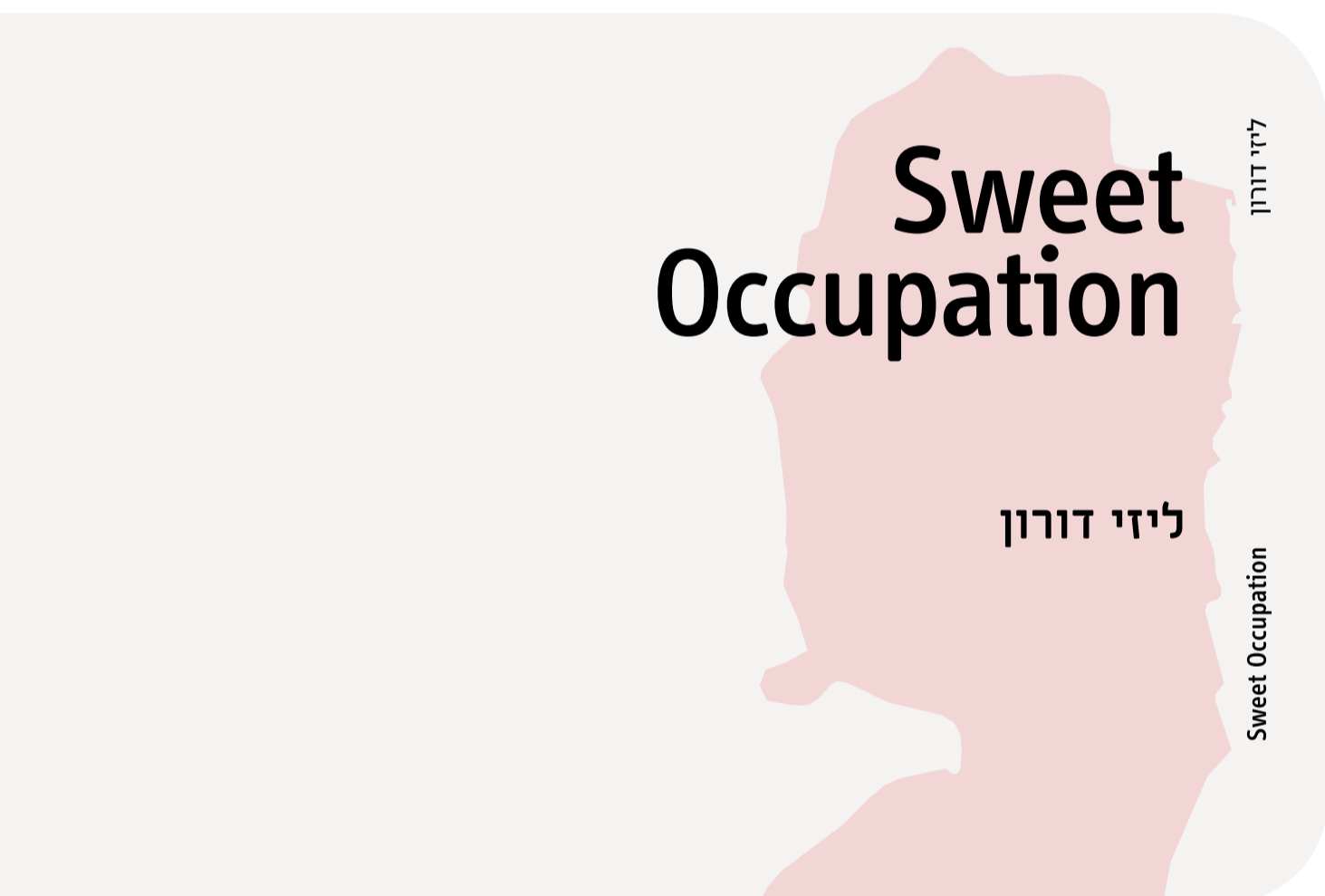
Sweet Occupation © Resling