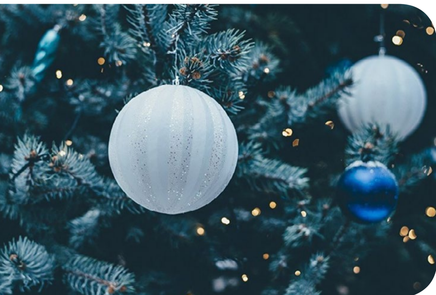
נקודת היפוך