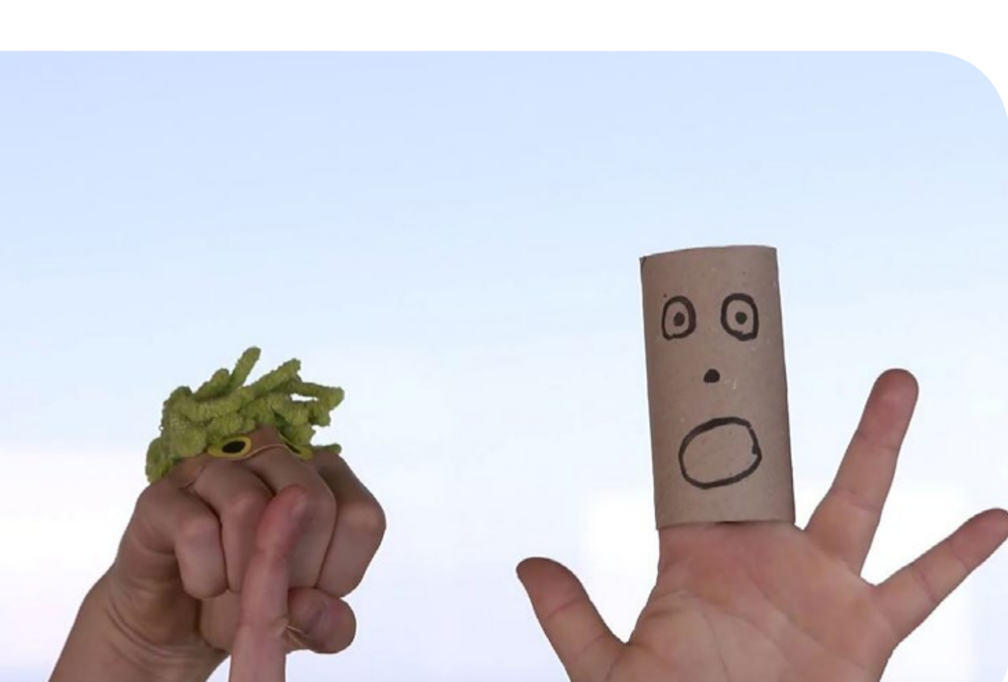
ערכת עזרה ראשונה © Train Theater Jerusalem