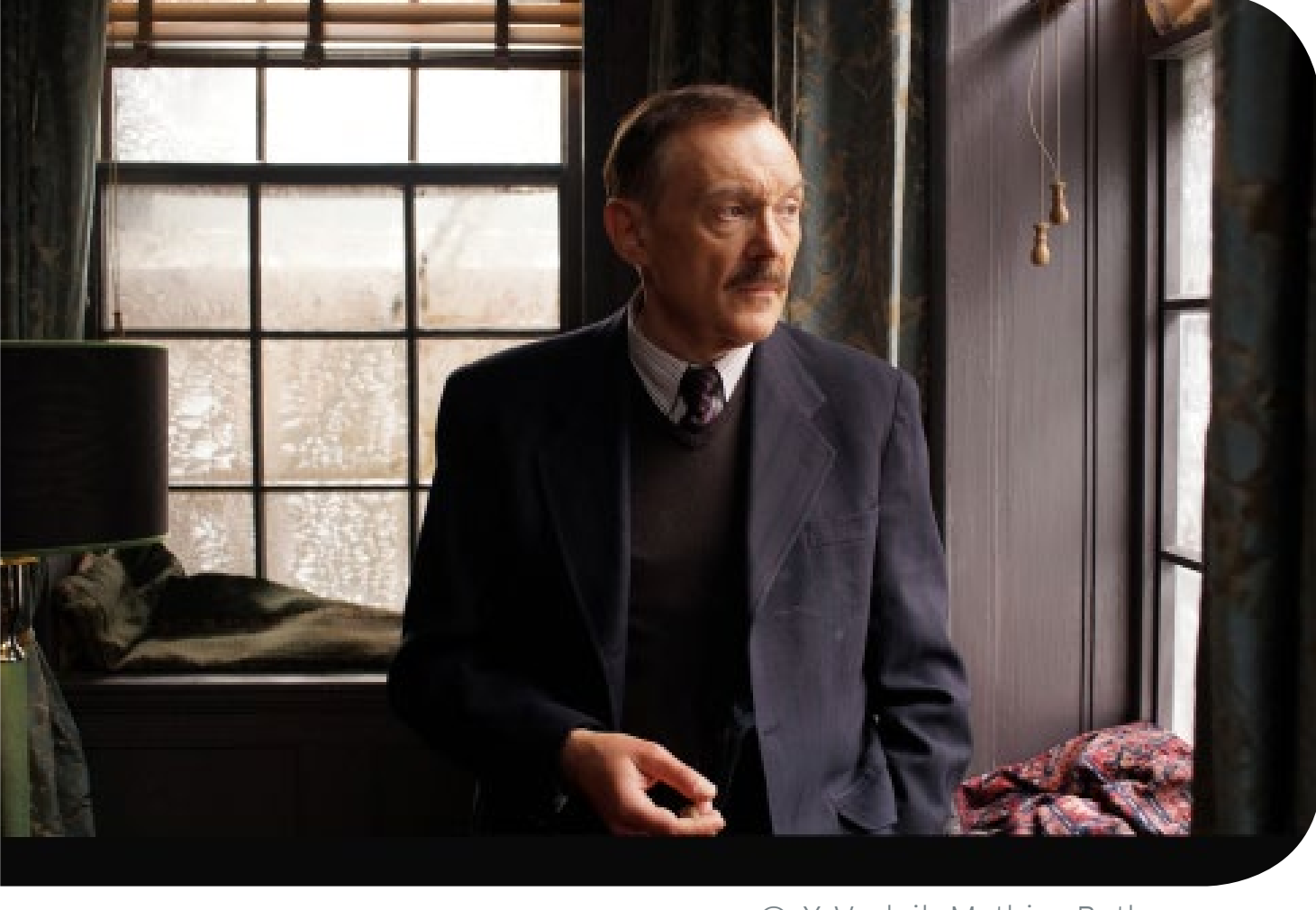
פרידה מאיחפה