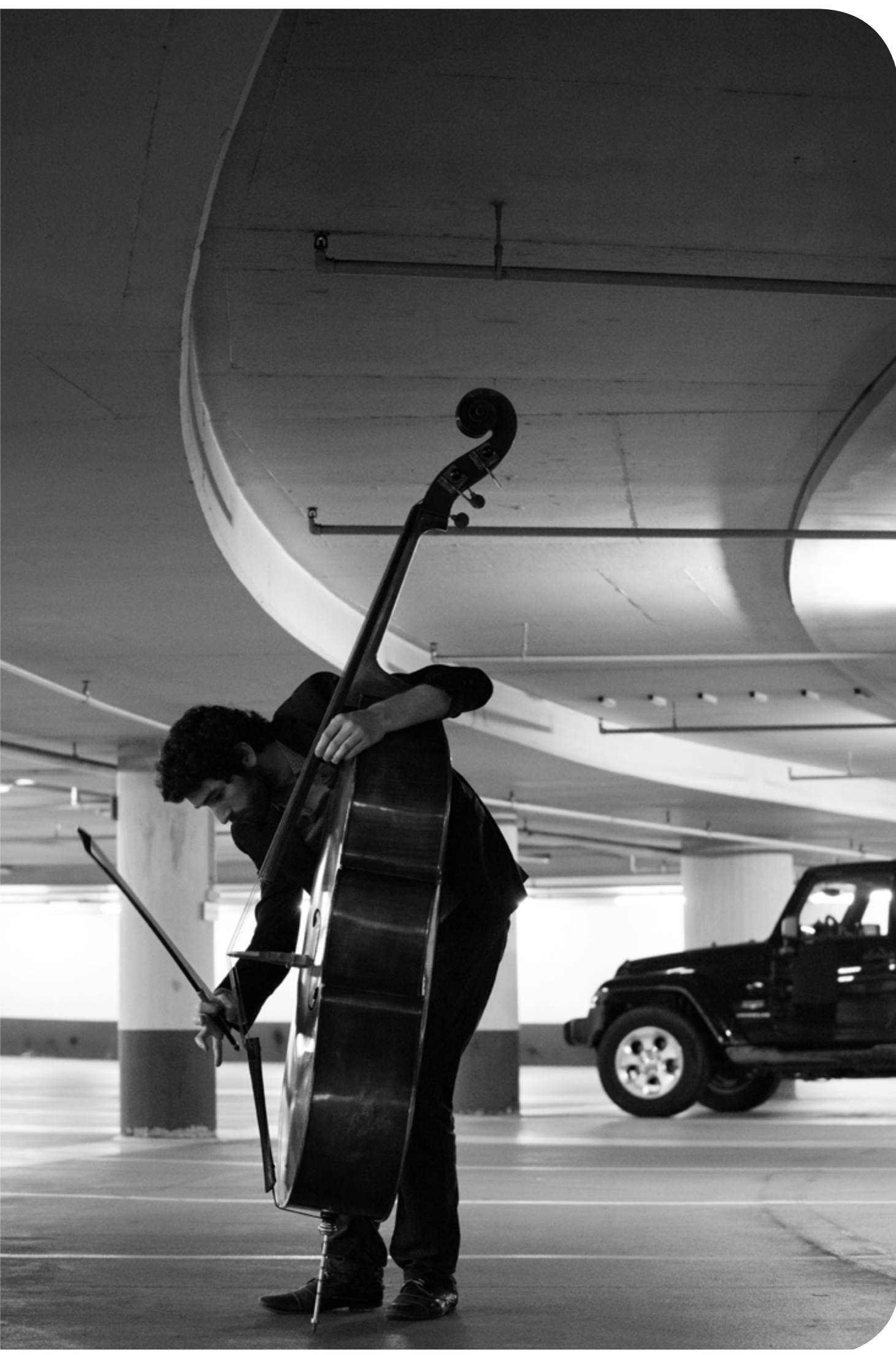
צליל מעודכן