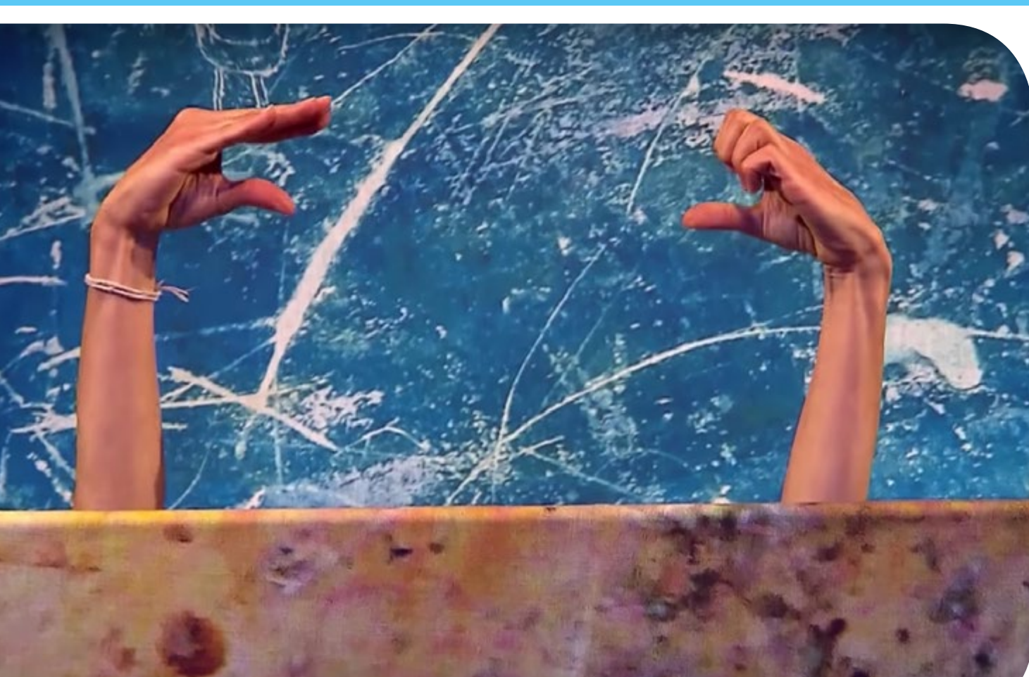
דומפו דינקי © Anne-Kathrin Klatt