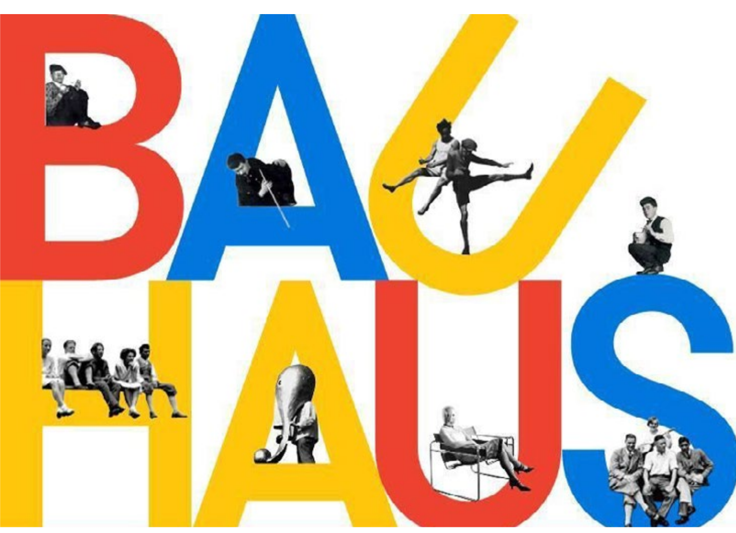
שוכרים את הכלים, יוצרים את כלים