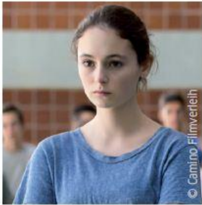
Lea van Acken