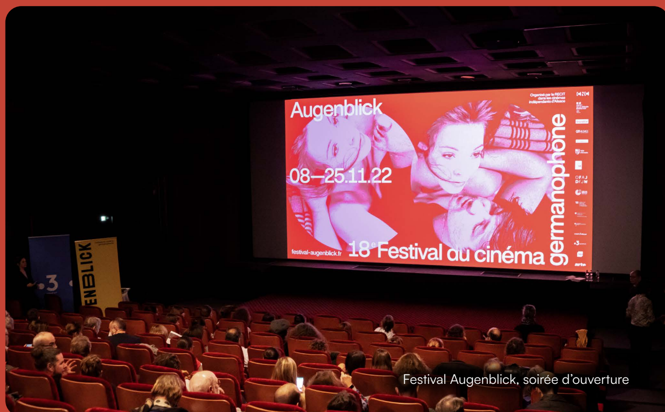
Festival Augenblick, soirée d'ouverture

Le Festival se donne comme objectifs la découverte de la culture et de la langue des pays voisins germanophones par le regard de leurs cinéastes et de rendre compte de la diversité de la production cinématographique germanophone à travers une programmation large et éclectique : sont programmés les films de réalisateurs confirmés, reconnus du public en France et dans le monde (W. Herzog, V. Schlöndorff, M. Von Trotta, F. Akin), des œuvres « grand public » ayant rencontré le succès au box-office allemand, des films jeunesse, des documentaires, courts métrages et films de répertoire. Le Festival met également un point d'honneur à diffuser les productions de la nouvelle génération de cinéastes.