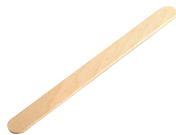
-r Holzspatel, ~ ไม้กีดลิ้น