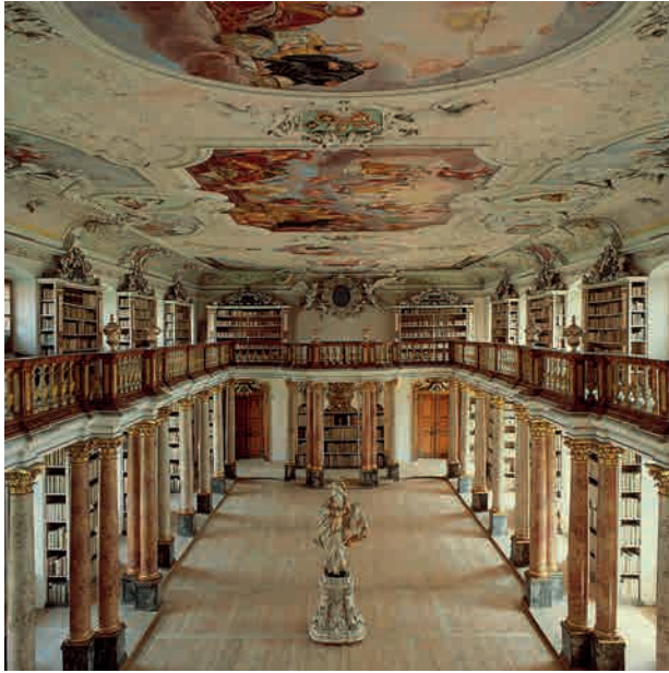
Die Bibliothek des Benediktinerklosters Ottobeuren im bayerischen Allgäu ist ein hervorragendes Beispiel für die Saalbibliothek des Barock. Die rundum angeordneten Bücherregale setzen sich nach oben in einer auf 44 Stückmarmorsäulen ruhenden Galerie fort. Mitten im Saal steht die Statue der griechischen Göttin Pallas Athene als der Beschützerin der Wissenschaften.