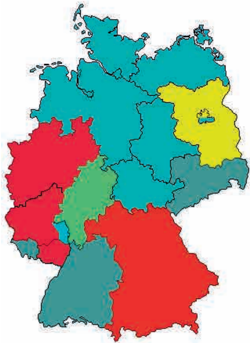
Verbundsysteme und -regionen in Deutschland, Stand 2011

Die Zusammenarbeit der Verbundsysteme erfolgt in einer Arbeitsgemeinschaft (AGV), deren Sekretariat in der Deutschen Nationalbibliothek angesiedelt ist. Trotz dieses Zusammenschlusses haben die Verbünde es bislang nicht geschafft, ihre Katalogdaten untereinander auszutauschen oder gar eine gemeinsame, nationale Verbunddatenbank zu erzeugen. Die meisten Verbünde (mit Ausnahme des HBZ) haben begonnen, ihre Daten an den von OCLC betriebenen WorldCat zu liefern. In letzter Zeit verstärken die Verbünde ihre Bemühungen zur Verbesserung der Kooperation und beginnen gemeinsame Datenpools,