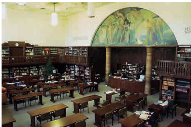
Den Historischen Lesesaal der Universitätsbibliothek Tübingen (Baden-Württemberg), errichtet 1912 (Architekt: Paul Bonatz), ziert ein breites Wandgemälde, das die Auseinandersetzung der Gegenwart mit der Weisheit der Vergangenheit darstellt. Die Bibliothek der 1477 gegründeten Universität Tübingen, Teil eines zweischichtigen Bibliothekssystems, betreut im Rahmen des DFG-Sondersammelgebietsprogramms drei Sammel Schwerpunkte, darunter die Theologie.

Die zum Zweck der überregionalen Literaturversorgung erworbenen Bestände werden formal und sachlich erschlossen und in den lokalen Bibliothekskatalogen sowie den regionalen und überregionalen Verbunddatenbanken nachgewiesen. Darüber hinaus können sie zusätzlich durch spezielle, konventionell oder elektronisch verbreitete Publikationen (Neuerwerbungslisten, Zeitschrifteninhaltsdienste) den interessierten