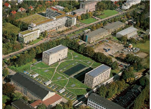
Die Sächsische Landesbibliothek – Staats- und Universitätsbibliothek Dresden konnte 2002 die bisherigen Bibliotheksstandorte einschließlich der Sondersammlungen, der Lehrbuchsammlung, der Deutschen Fotothek und mehrerer Zweigbibliotheken und damit 6 Mio. Medieneinheiten in einem Neubau vereinigen (Entwurf: Ortner und Ortner). Auf die Benutzer warten 900 Leseplätze, davon 200 im zentralen Lesesaal. 1993 wurde die Sächsische Landesbibliothek mit dem Sondersammelgebiet „Zeitgenössische Kunst ab 1945“ am Sammelschwerpunktprogramm der DFG beteiligt.

27 leistungsfähige Staats-, Universitäts- und Spezialbibliotheken tragen heute auf der