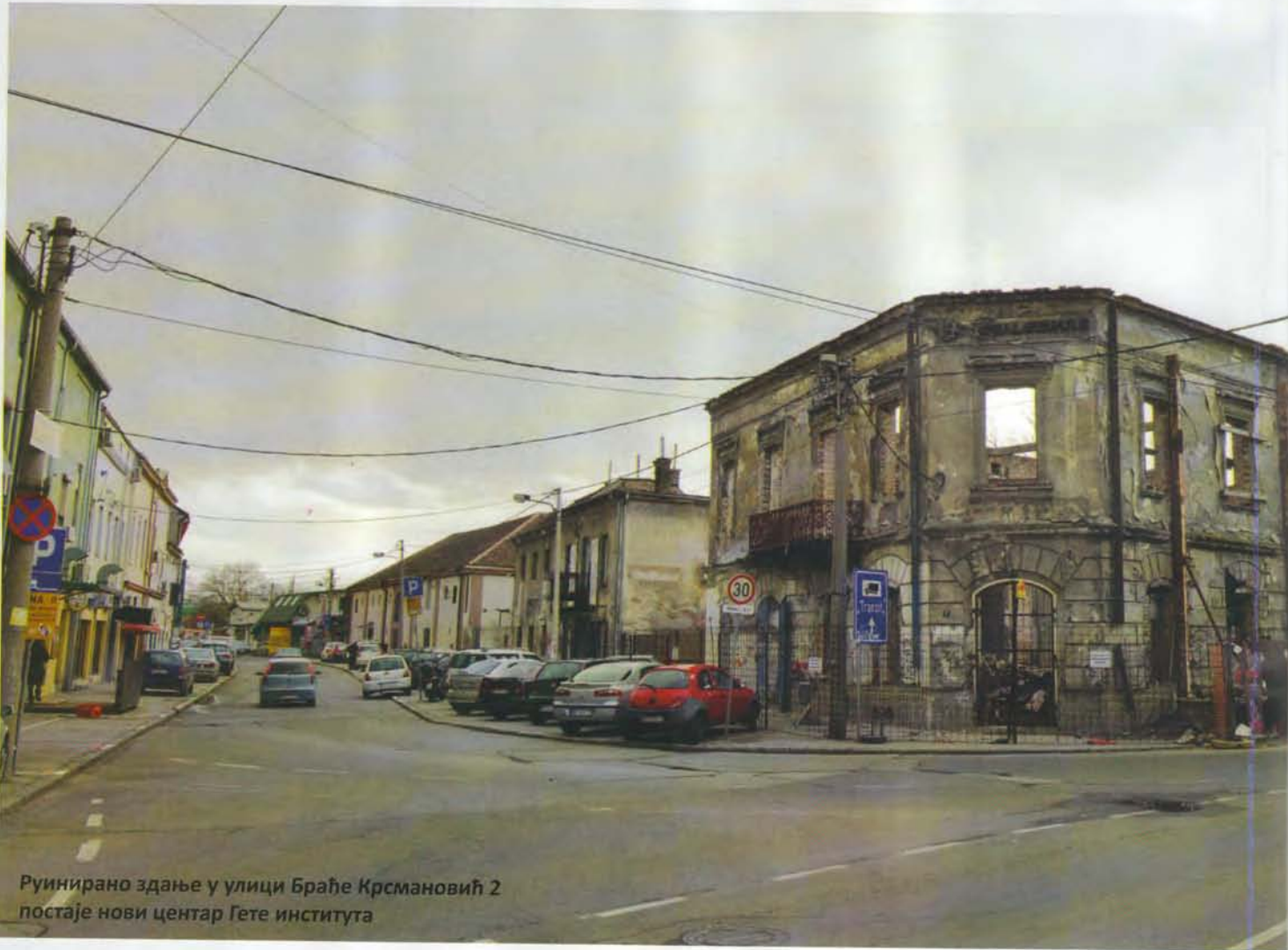
Руинирано здање у улици Браће Крсмановић 2 постаје нови центар Гете института

У Београду је крајем фебруара почела реализација пројекта "Урбани инкубатор: Београд", који је посвећен развоју старе градске четврти Савамале. Будућност Савамале у оквиру "Урбаног инкубатора" неће стварати урбанисти, политичари и инвеститори, већ уметници, архитекте и активисти различитог профила, који ће годину дана заједнички улагати напоре у ревитализацију те значајне градске четврти.