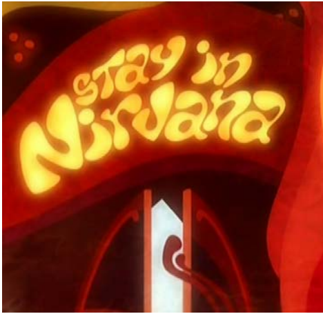
„Bleibe im Nirwana“

Der Rocksänger ist durch die bunte Welt gewandert und steht jetzt vor zwei Türen.