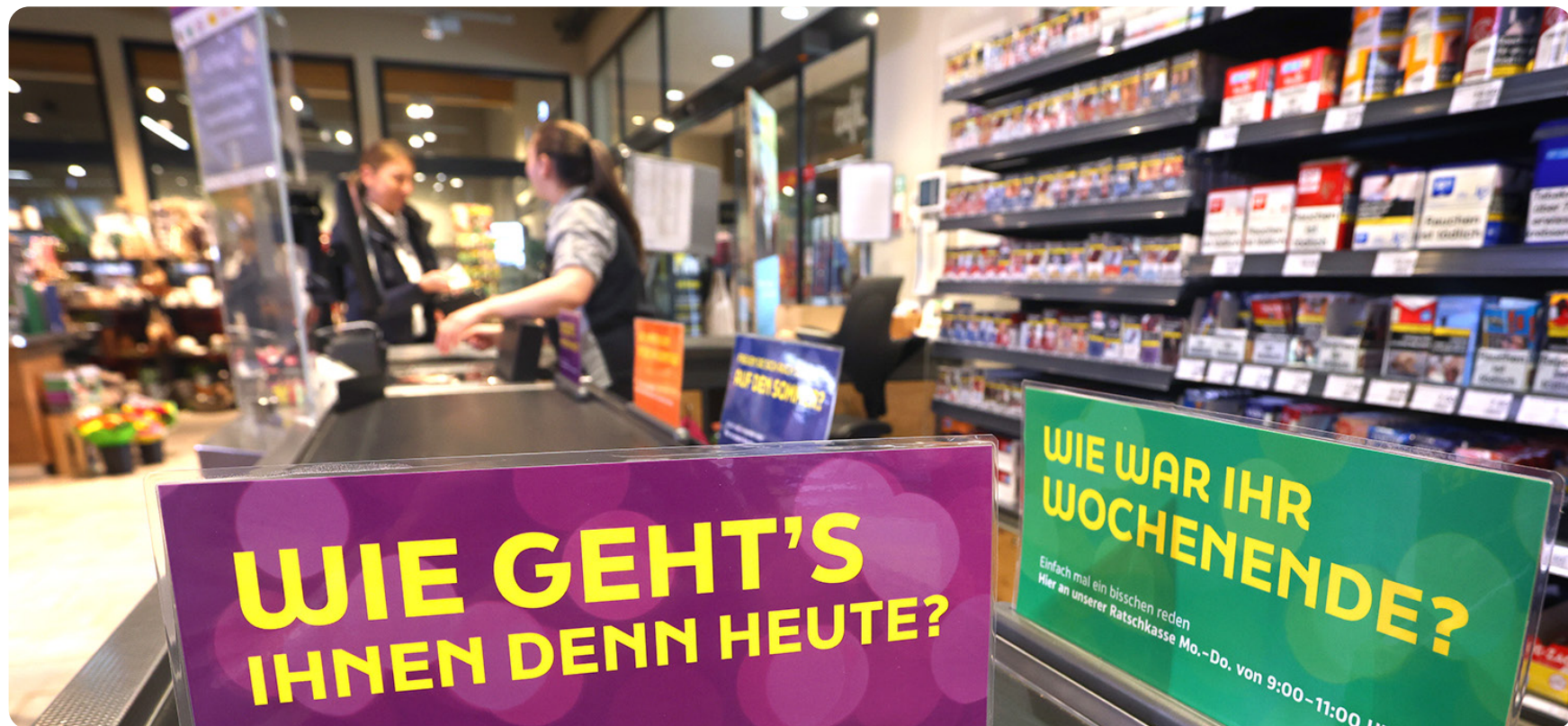
Einfach mal ein bisschen reden – das geht sogar beim Einkaufen in manchen Supermärkten an der Plauderkasse.

Sprachtraining · Landeskunde · Vokabelhilfen · Übungsmaterial