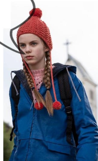
© Ricardo Vaz Palma - In Good Company