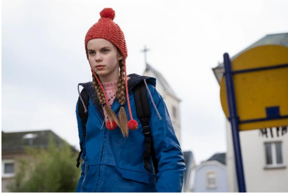
© Ricardo Vaz Palma - In Good Company