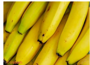
die Banane, die Bananen

2 In der BRD und der DDR gab es zwei sehr unterschiedliche Wirtschaftssysteme. In der BRD gab es die Marktwirtschaft, das Wirtschaftswunder und eine große Konsumgesellschaft. In der DDR gab es die Planwirtschaft und oft einen Mangel an wichtigen Produkten. Deshalb konnten Menschen dort nicht alles kaufen, mussten lange auf Produkte warten und haben von Verwandten Pakete aus der BRD bekommen. Hier siehst du wichtige Begriffe und ihre Definitionen. Welche Definition passt zu welchem Begriff? Verbinde die passenden Kombinationen.