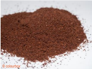
der Kaffee, die Kaffees

1 Wie heißen diese Produkte? Schreibe die passenden Wörter unter die Fotos.