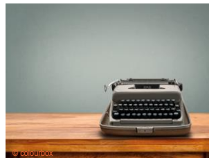
die Schreibmaschine, die Schreibmaschinen