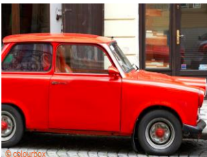
der Trabant, die Trabanten (der Trabi/die Trabis)