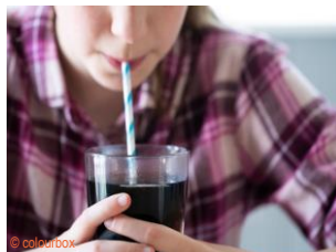
die Coca-Cola, die Coca-Colas