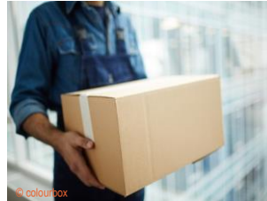
das Paket, die Pakete