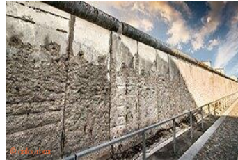
die Berliner Mauer