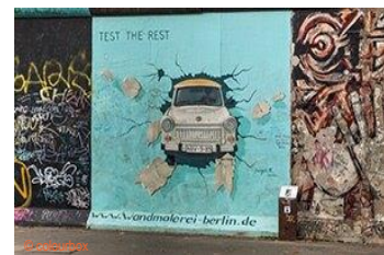
die East Side Gallery

2 Wiedervereinigung, Wende, was? Von der Teilung Deutschlands bis zur Wiedervereinigung war es ein langer Weg. Sieh dir den Zeitstrahl an und lies die Texte. Verbinde die Texte mit den passenden Titeln auf dem Zeitstrahl.