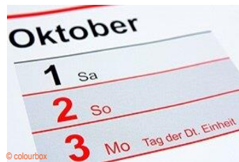
der Tag der Deutschen Einheit