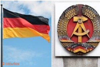
die BRD-Flagge und das Symbol der DDR-Flagge

1 Vier Jahrzehnte lang gab es zwei deutsche Staaten. Hier siehst du sechs Bilder aus der deutsch-deutschen Geschichte. Welches Wort passt zu welchem Bild? Schreibe die Wörter unter die Fotos.