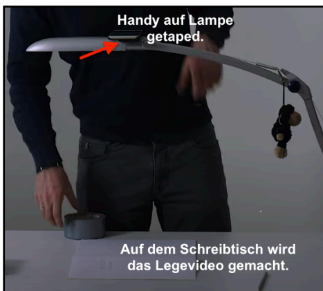
Lernvideos erstellen Betzold TV https://youtu.be/hJKnF-h3ldM

Tipp: Ihr könnt auch ein Legetechnik-Video mit dem Videomaker von SimpleShow machen: https://videomaker.simpleshow.com/de/ . Das geht schneller. Ihr müsst nur den Sprechtext erstellen und das Video anschließend damit unterlegen.