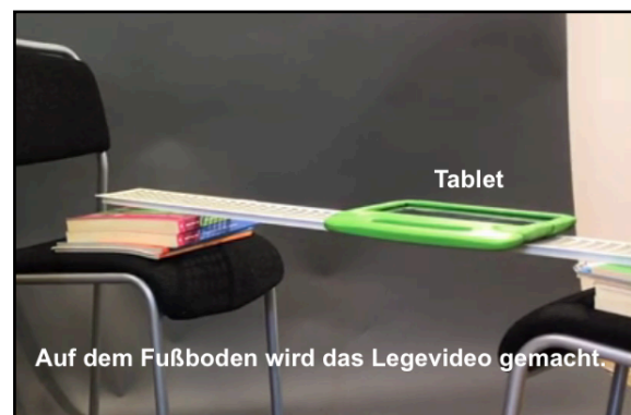
Making of Legevideo WiBS https://youtu.be/tOmK8_vQBMQ