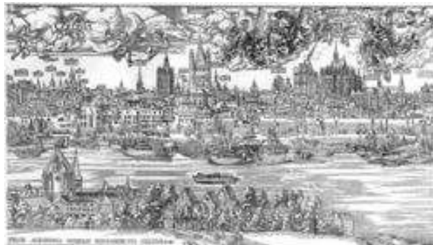
Köln um 1504

2.10 Am Fischmarkt/Restaurant „Das kleine Stapelhäuschen“: Was war das Stapelrecht?