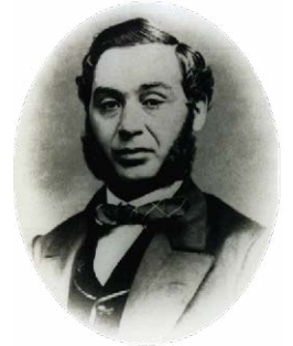
Levi Strauss ca. 1850