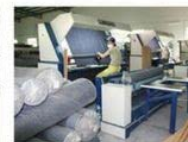
Review & Rolling