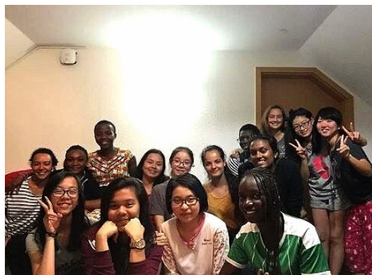
写真1：寮で共に過ごした仲間たち Foto1: Meine Freundinnen im Wohnheim

今回、このJUKUの運営に携わった多くの方々、Goethe-Institutの関係者の方々、日本の先生方、家族、また参加者を支えてくれたすべての方々に、このプログラムに参加できたことに対して心から感謝申し上げます。