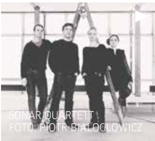
SONAR QUARTETT