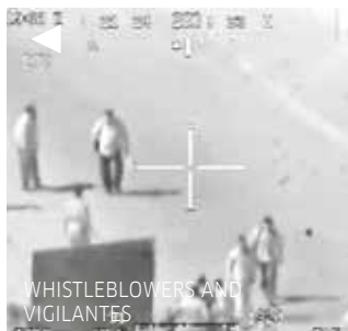
WHISTLEBLOWERS AND VIGILANTES