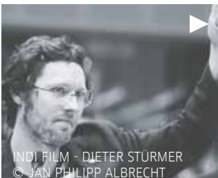
INDI FILM - DIETER STÜRMER © JAN PHILIPP ALBRECHT