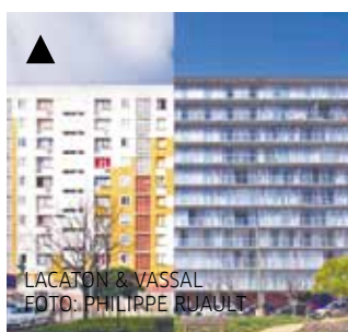
LACATON & VASSAL