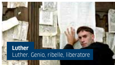
Luther Luther. Genio, ribelle, liberatore

Charleen, 16 anni non ancora compiuti, è sopravvissuta a un tentativo di suicidio e ora cerca di trovare serenità. Ma non è facile: il padre è stato cacciato fuori dalla madre, che addirittura ora vive insieme all'insegnante di biologia di Charleen; ha poi litigato con la sua amica Isa, e, come se non bastasse, nell'ambulatorio del suo caotico psicoterapeuta incontra Linus, l'antipatico secchione della classe.