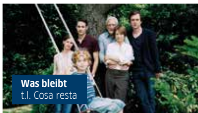
Was bleibt t.l. Cosa resta

Scampato alla morte durante un uragano, Martin Lutero entra in monastero, dove si dedica al digiuno e alla preghiera. Quando il suo vicario lo invita a Roma a conoscere il mondo, Lutero si indigna davanti alla corruzione del clero e alla vendita delle indulgenze. La lotta che intraprenderà per ricondurre la Chiesa ad una fede più pura cambierà la storia del mondo.