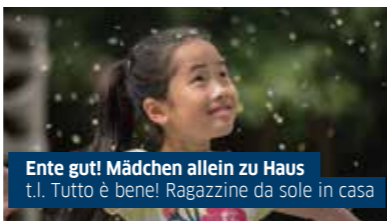
Ente gut! Mädchen allein zu Haus t.l. Tutto è bene! Ragazze da sole in casa

Per salvare la macelleria di famiglia a Colonia, il ventenne Mohsen, di origine iraniana, deve andare in Polonia a comprare delle pecore a buon mercato. Durante il viaggio, si ritrova bloccato in un paesino della ex Rdt dove il tempo si è fermato: qui si innamora della giunonica meccanica Ana, ma una serie di equivoci lo fa scambiare da tutti per un ricco persiano venuto a risollevare l'industria tessile del posto.