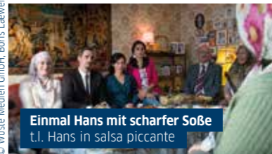
Einmal Hans mit scharfer Soße t.l. Hans in salsa piccante