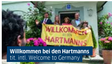
Willkommen bei den Hartmanns tit. intl. Welcome to Germany

Jack ha dieci anni e vive in una casa-famiglia. È estate, l'eccitazione per le vacanze imminenti è grande ma, all'ultimo giorno di scuola, nessuno viene a prenderlo. Di sua madre Sanna, che con fatica si occupa da sola di lui e del fratello più piccolo, sembra essersi persa ogni traccia. Dopo una lite, Jack, impaurito, scappa dalla casa-famiglia e con il fratellino si mette in cerca della madre.