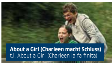
About a Girl (Charleen macht Schluss) t.l. About a Girl (Charleen la fa finita)

Hartmut è un tassista burbero, che gli anni e il divorzio dalla moglie hanno reso ancora più scorbutico. Quando sul taxi sale una giovane turca e la figlia di 6 anni, Hayat, non potrebbe mai immaginare di ritrovare giorni dopo la bambina sola in pieno centro a Norimberga. "Hayat" vuol dire "vita" in turco, ed è quello che il protagonista di questa commedia agrodolce ritroverà nel suo senso più pieno, grazie a un incontro che ha la magia del destino.