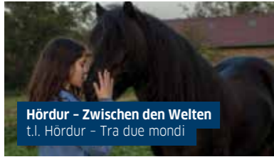
Hördur - Zwischen den Welten t.l. Hördur - Tra due mondi