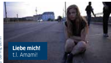
Liebe mich! t.l. Amami!

La famiglia di Ismael, originaria dell'Anatolia e trapiantata in Germania, ha un problema spinoso: la figlia Fatma è incinta e deve sposarsi al più presto, ma, come tradizione vuole, dev'essere Hatice, la sorella maggiore, a trovare prima marito. Hatice sogna di sposare un tedesco che possieda la passione di un turco, ma dove cercarlo?