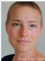
アンティエ・テプファー Antje Töpfer (人形劇作家)

現代美術家、京都造形芸術大学教授/美術工芸学部長。1989 年「アゲインスト・ネチャー展」。1993 年ベニスビエンナーレ・アペルト。2001 年横浜トリエンナーレ。2003 年水戸芸術館「国連少年展」。2009 年京都国立近代美術館「GOLD/WHITE/BLACK」展。2011 年妙心寺退蔵院障壁画プロジェクトディレクター。瀬戸内トリエンナーレ 2013、小豆島響の郷十坂手港エリアディレクター。