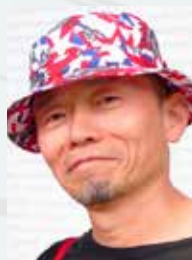
椿 昇 Noboru Tsubaki (現代美術家)

1973 年生まれ。デュッセルドルフとロンドンでデザインを学んだ後、デザイン研究、メディアアート、科学技術の境界で活動。時間をテーマにした作品「クロノ・シュレッダー」で国際的に大きな注目を集めた。パーゼル造形芸術大学研究員。2014 年 10 月～15 年 3 月末まで千葉大学特任助教。京都滞在中は、のぞきからくり等、日本の歴史的な視覚装置や錯覚装置を調査し、地域固有の記憶と関連付けた作品を創る予定。公式サイト www.susannahertrich.com