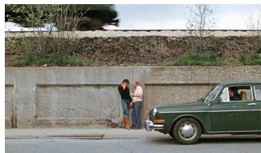
11 x 14