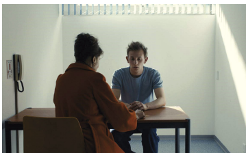
ONDES DE CHOC