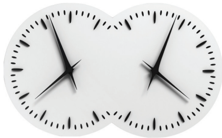
Anges Inseparables © Esther Shalev Gerz

***22:00 | SCIENCES DE LA VIE | Joy Sorman | Mix | Hall du Palais des études | 5h***