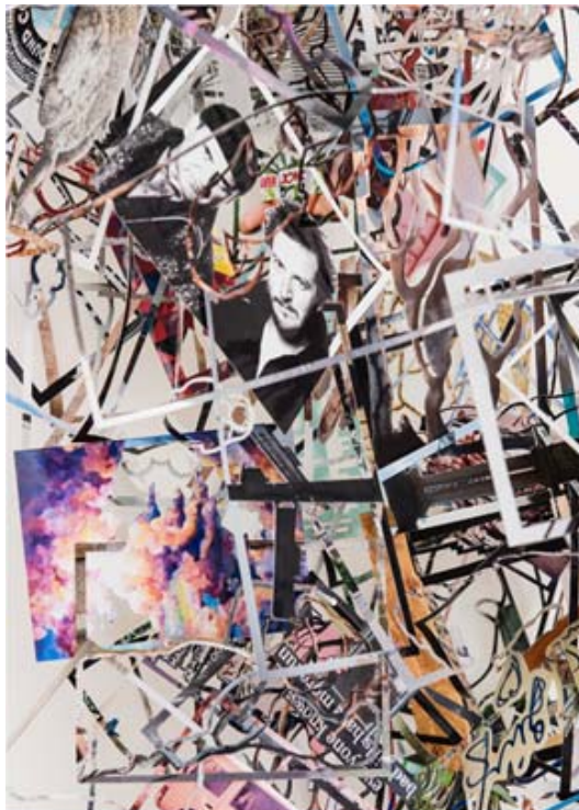
© Lilly Lulay: Liquid Portrait Sculpture