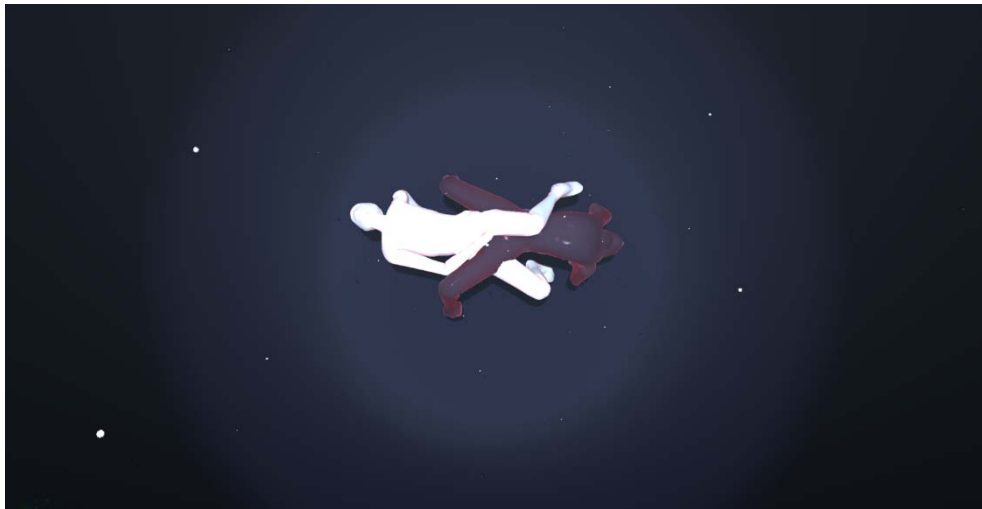
© Margarethe Kollmer: Still aus "The Thing Is", 2017