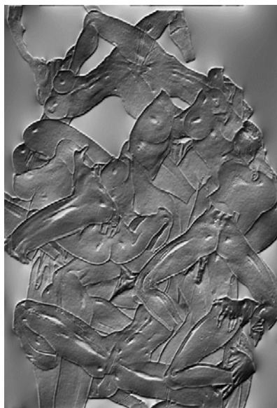
© Simon Speiser, W-TAILS CAT 2, 2017, digital Print in Aluminium, 100x150cm