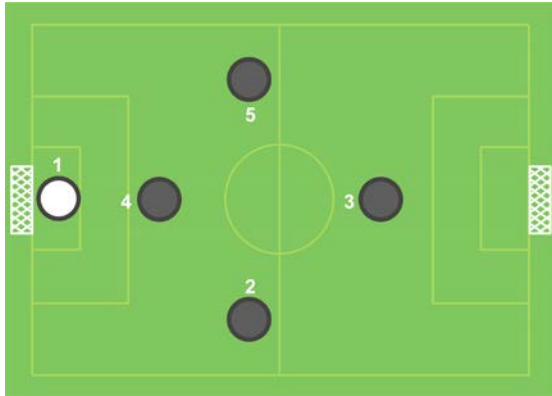
Text 1: Aufstellung 1-2-1