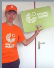
Referente Goethe Institut