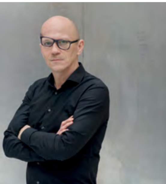
Philipp Lahm

■ Théâtre de la Manufacture CDN de Nancy Lorraine | 8 rue Baron Louis Allemand, surtitré en français