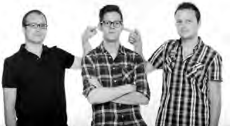
Das letzte Känguru