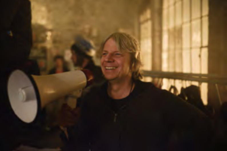
Als wir träumten