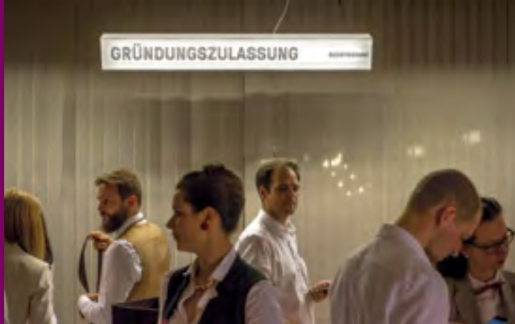
Prinzip Gonzo