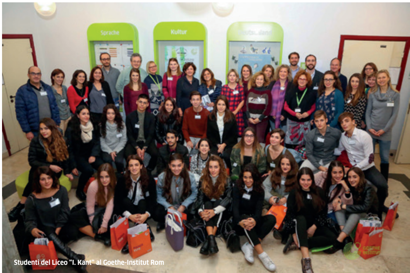
Studenti del Liceo "I. Kant" al Goethe-Institut Rom