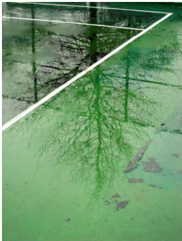
Greenpoint, 2008