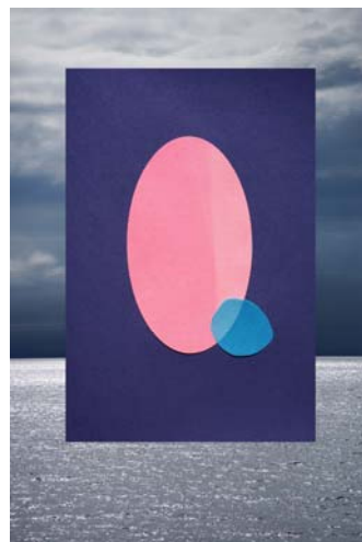
By the lake, 2018