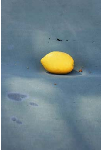
A Lemon, 2018 © Jessica Backhaus

Nous vous remercions de nous faire parvenir un exemplaire.