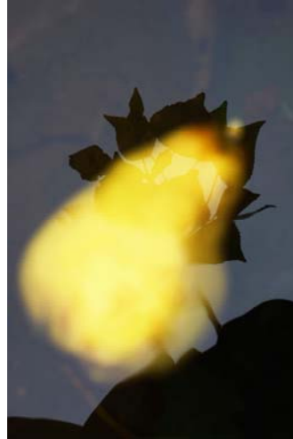
Ein Augenblick, 2015 © Jessica Backhaus