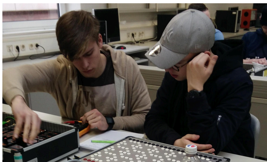
Rencontre entre jeunes allemands de Merzig et jeunes français de Dombasle

Un tel projet nécessite des fonds. L'aide du CAMT et du Rectorat a donc été la bienvenue.