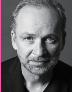
Ferdinand von Schirach