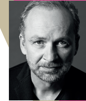
Ferdinand von Schirach