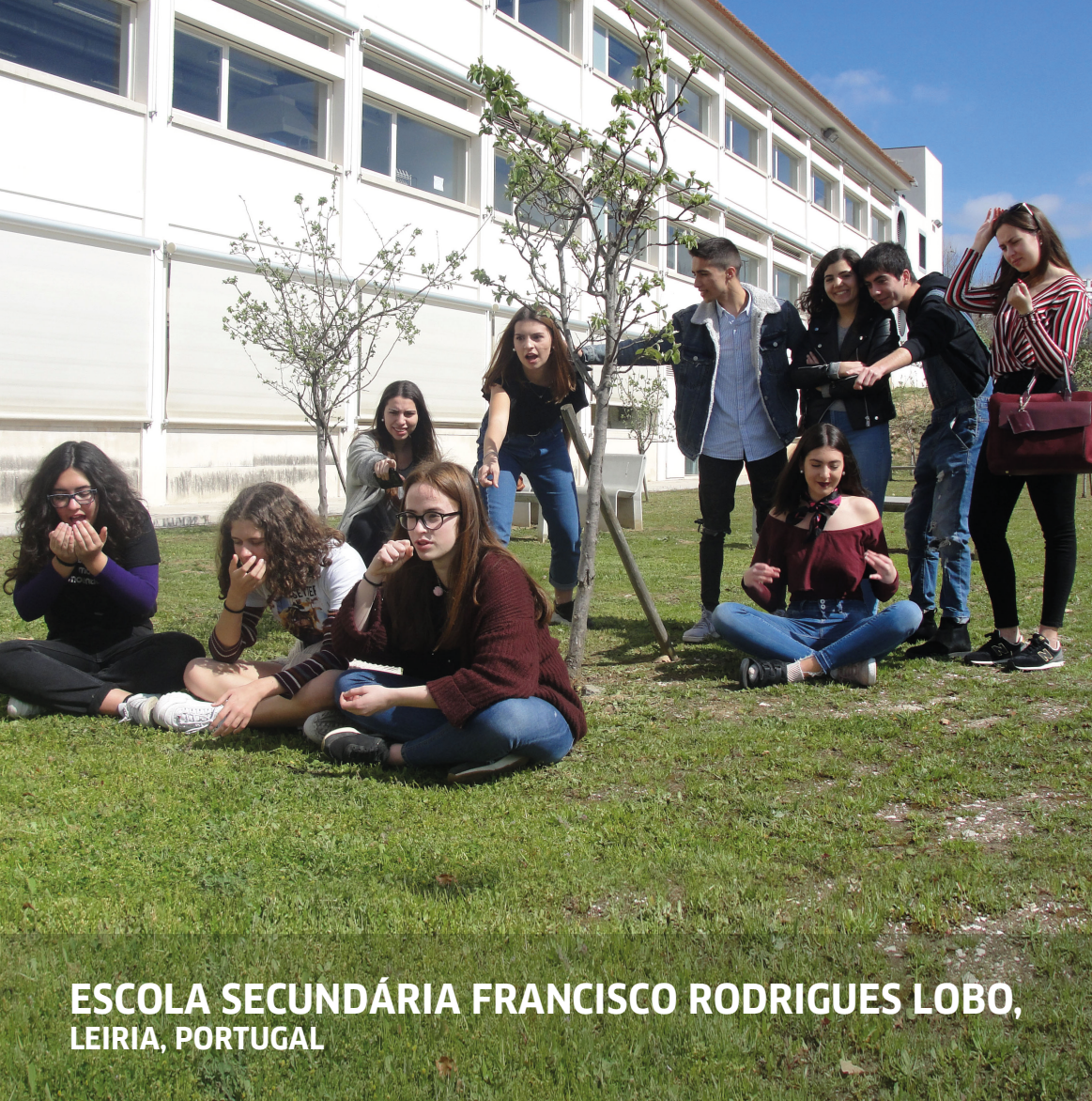
ESCOLA SECUNDÁRIA FRANCISCO RODRIGUES LOBO, LEIRIA, PORTUGAL