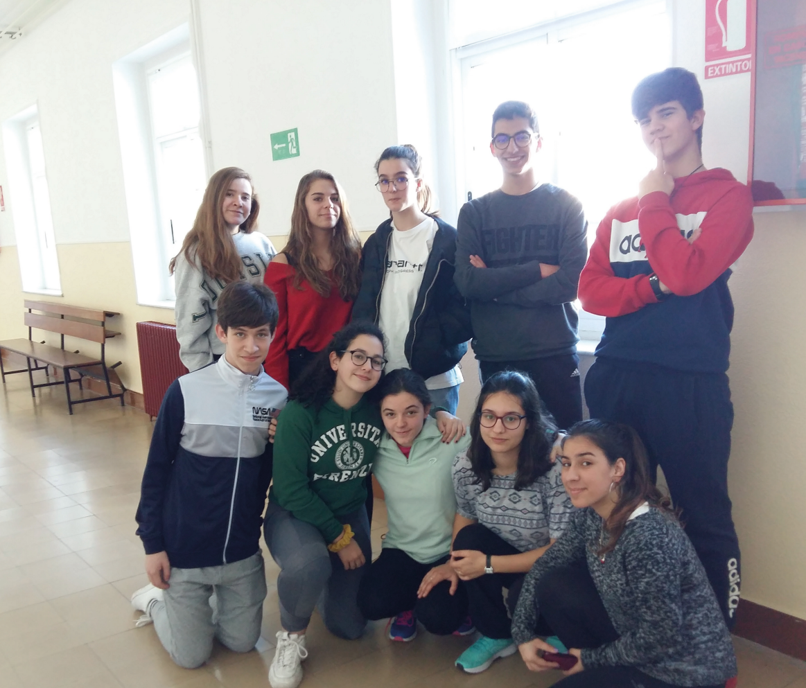
IES NOSA SEÑORA DOS OLLOS GRANDES, LUGO, SPANIEN