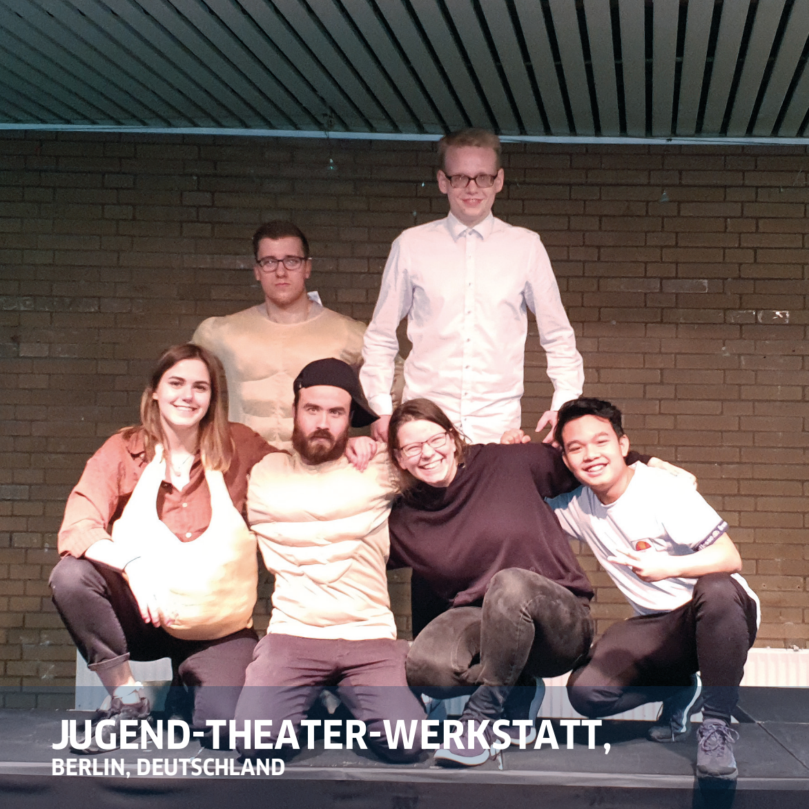
JUGEND-THEATER-WERKSTATT, BERLIN, DEUTSCHLAND