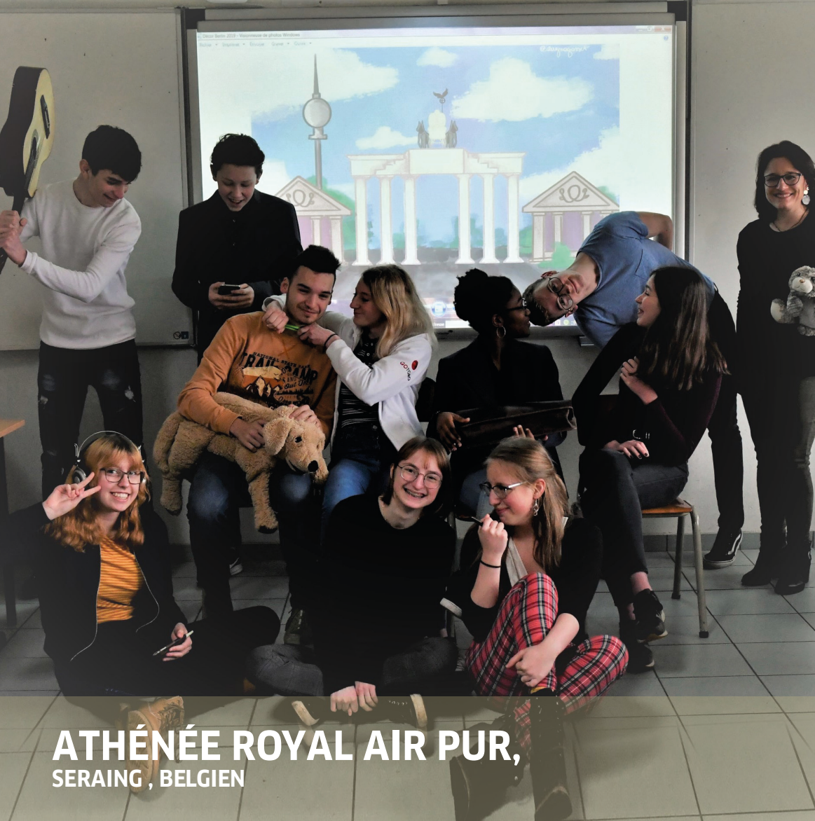
ATHÉNÉE ROYAL AIR PUR, SERAING , BELGIEN