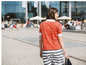
Regisseurin: Angela Schanelec.