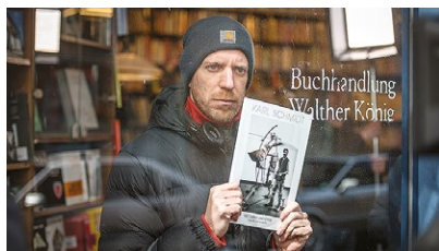
Regie: Arne Feldhusen.