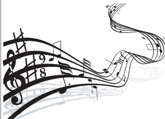
Text: Florian Weber; Verlag: Sportfreunde Edition © by Edition Sportfreunde / Arabella Musikverlag GmbH Universal Music Publishing GmbH Mit freundlicher Genehmigung von Universal Music Publishing GmbH

Applaus mein/meine dein/deine machst/lachst Hand/Hammer