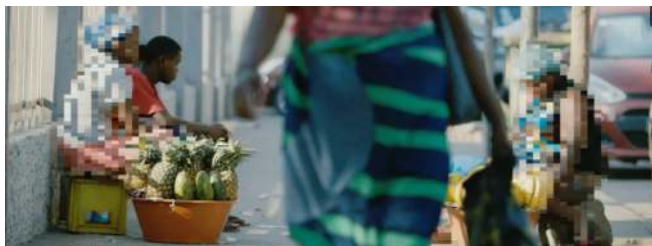
Cut it Out - Filmes contra a censura Geração 80 (Angola)