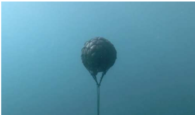
Cut it Out - Filmes contra a censura Mischa Leinkauf (Alemanha)