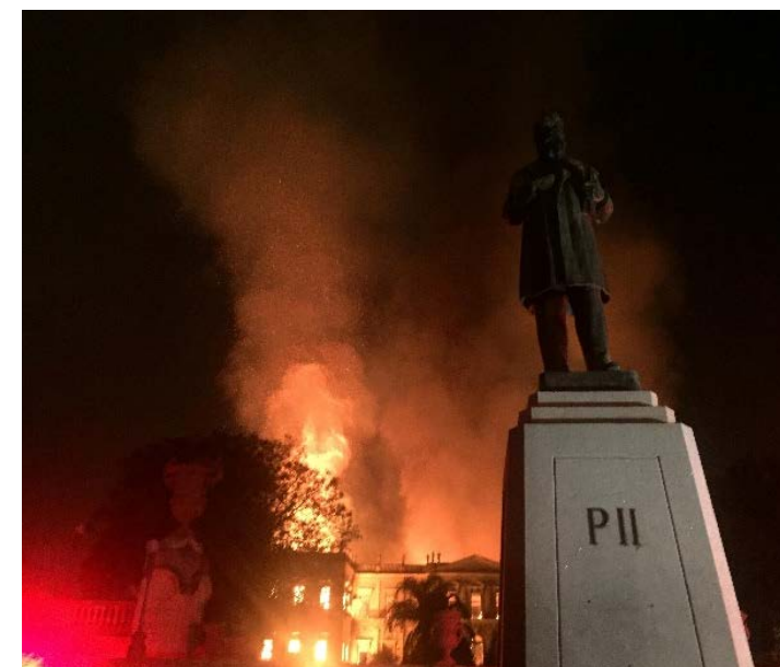
Rio de Janeiro, 2018