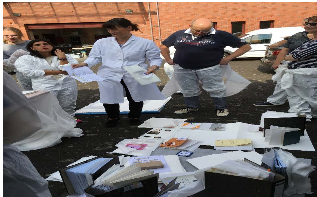
Liga de Emergência dos Arquivos e Bibliotecas, Exercício em 12.09.2018