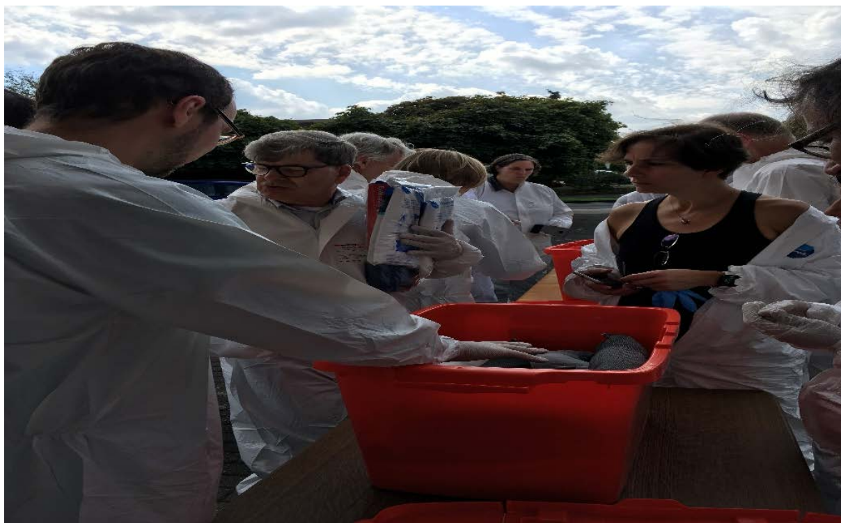
Liga de Emergência dos Arquivos e Bibliotecas de Colônia, Exercício em 12.09.2018