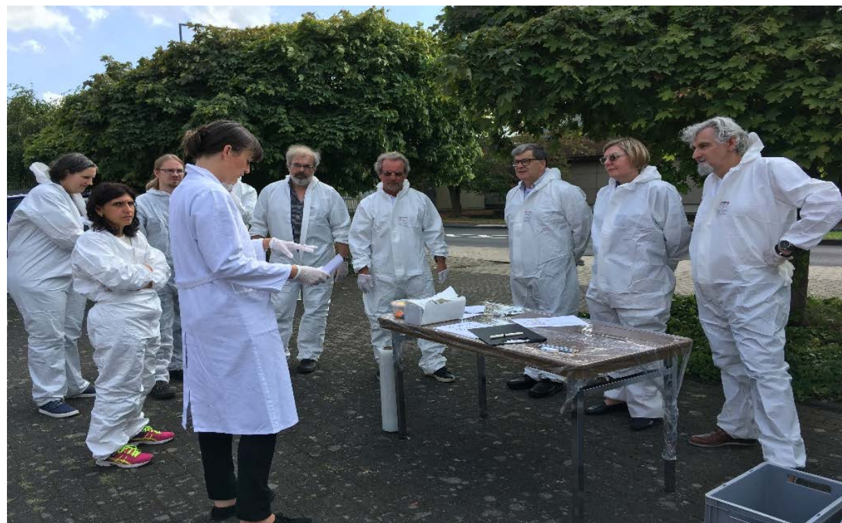
Liga de Emergência dos Arquivos e Bibliotecas de Colônia, Exercício em 12.09.2018