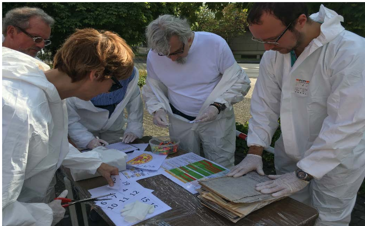
Liga de Emergência dos Arquivos e Bibliotecas, Exercício em 12.09.2018