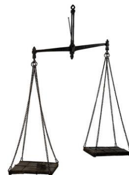
Balance d'Antoine Fournel, fer et bois, 1760.