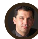
Тициан Йост Төгөлдөр хуур

“GMUB-д зөвхөн жазз төдийгүй орчин үеийн хөгжмийн бусад салбарын мэдлэг чадварыг шинэлэг байдлаар олгож байна. Суралцагчдын урам зориг, хүмүүсийн шинийг эрэлхийлж, сурч мэдэх гэсэн хүсэл үнэхээр гайхалтай.”