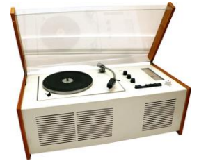
SK 55/Design Dieter Rams