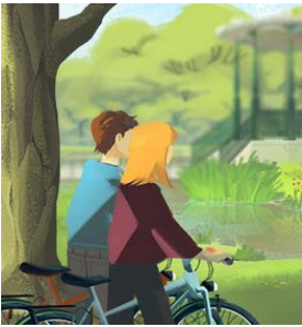
Illustrations © ovos media GmbH

Nachhaltigkeit ist auch für die Freunde in München ein großes Thema. Kannst du dich erinnern, was sie tun, um die Umwelt zu schützen?