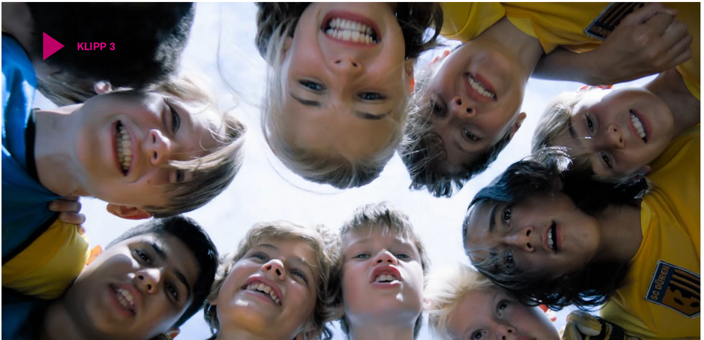
Klipp 3