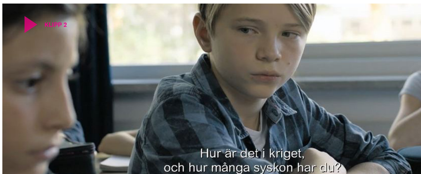
Klipp 2