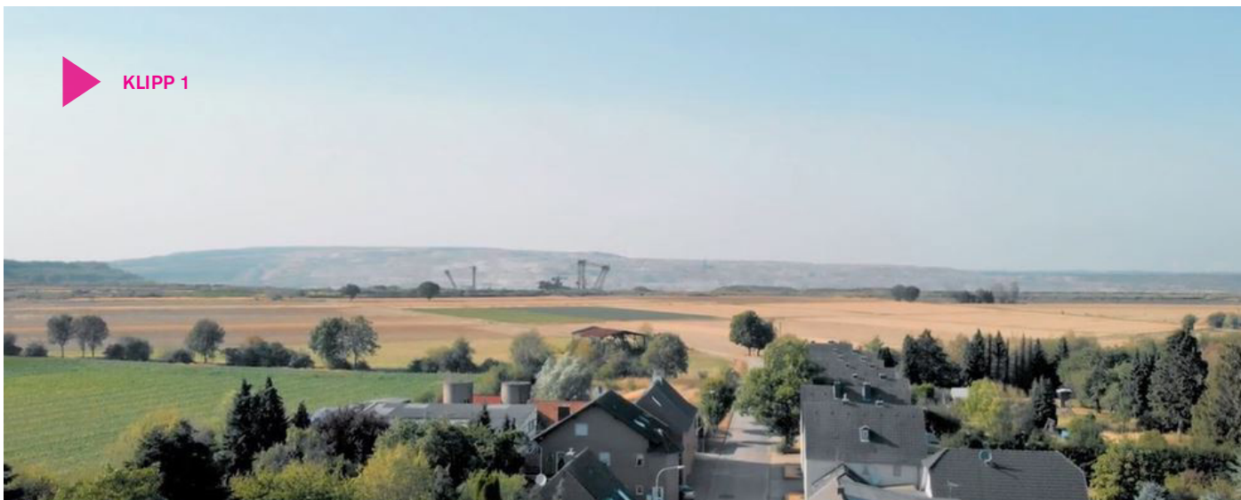
Klipp 1