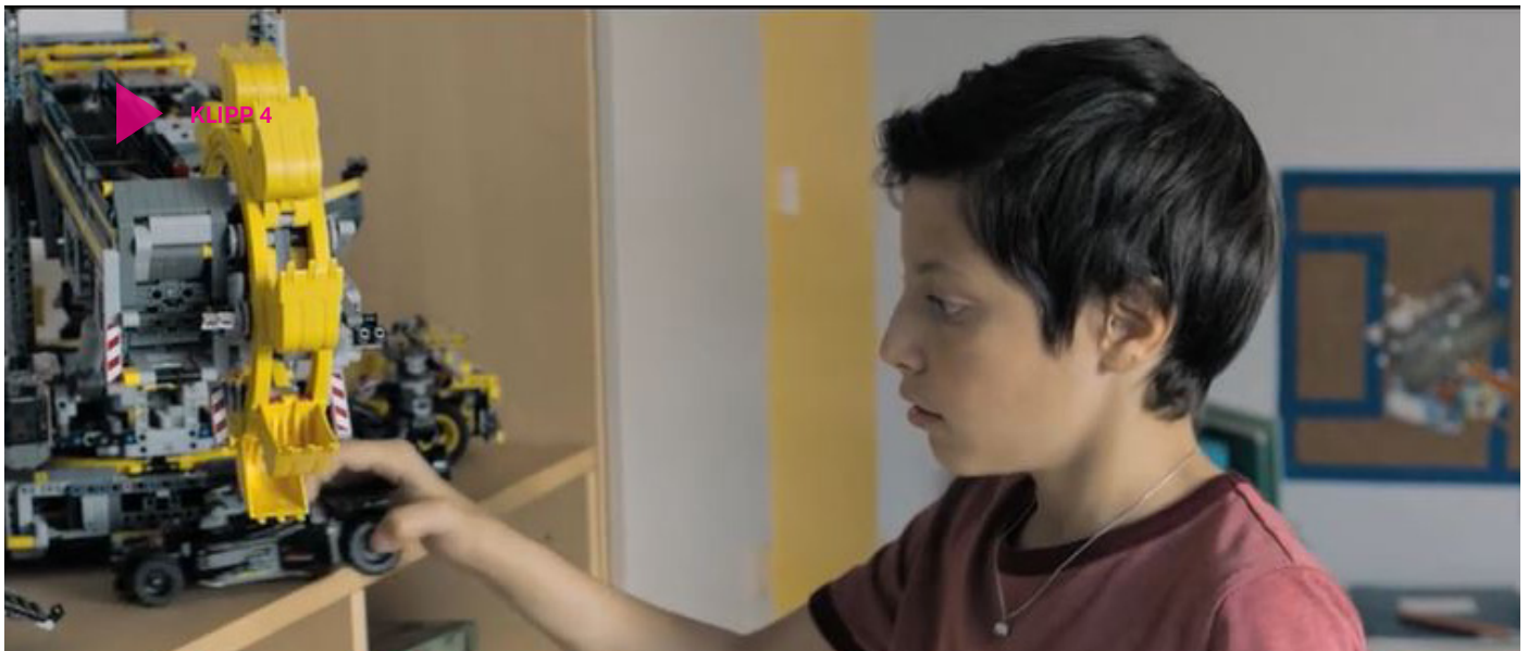
Klipp 4